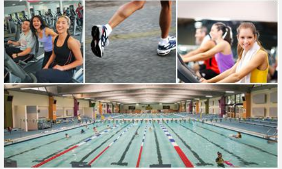
UNSW Fitness & Aquatic Centre

新南威尔士大学有丰富课外活动、社团活动可以供学生们自由参加，除此之外，悉尼的魅力也是不容错过的。