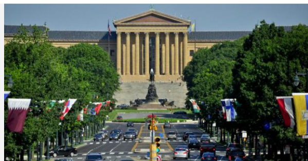
本杰明·富兰克林大道