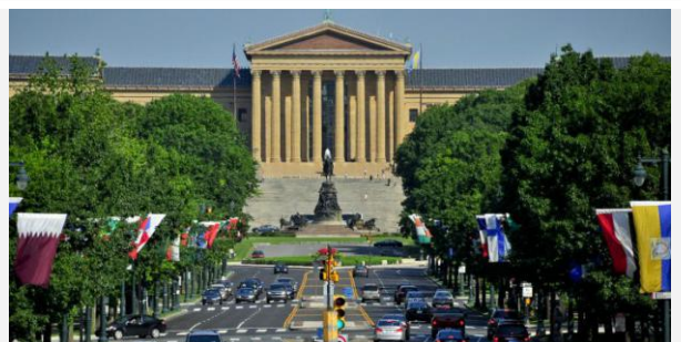
本杰明·富兰克林大道