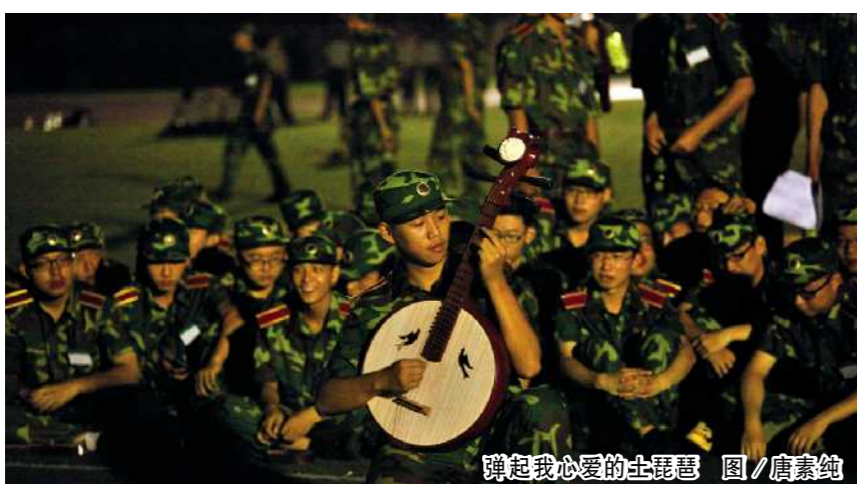
弹起我心爱的土琵琶