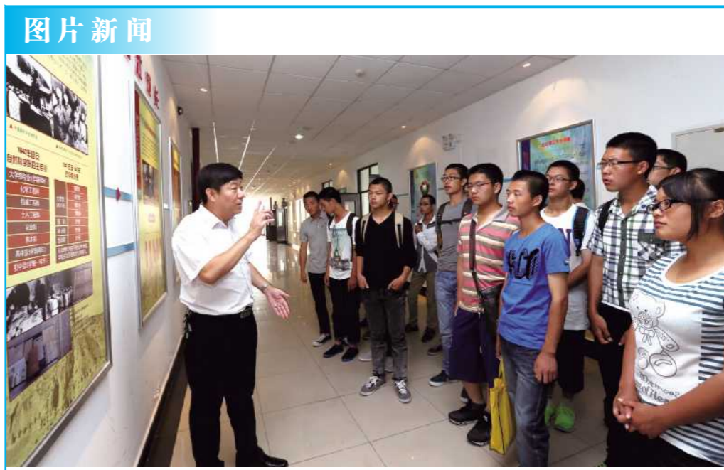
今年9月,设在良乡校区的“北京理工大学校史展”迎来了第一批参观者——生命学院的本科新生。“北京理工大学校史展”使良乡校区的师生们可以随时了解学校的光荣史,为师生们增添了又一份内容丰富的“精神食粮”,展览共有展板132块,几乎囊括了校史馆中的精彩内容,并增添了不少最新的学校信息,成为了校史馆外又一个进行校情校史教育的重要基地。