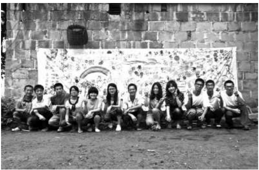
远方除了遥远,是否一无所有?