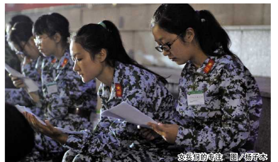
女兵们的专注