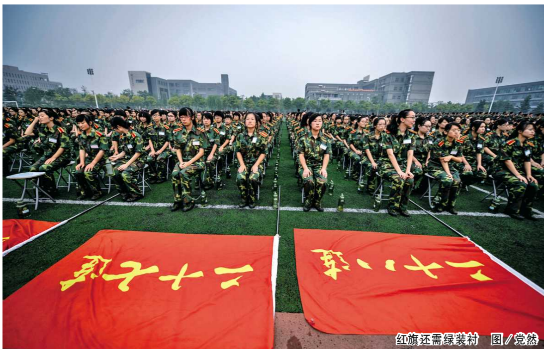
红旗还需绿装衬