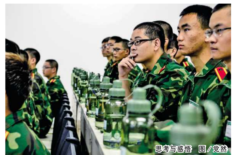
思考与感悟 图/党然