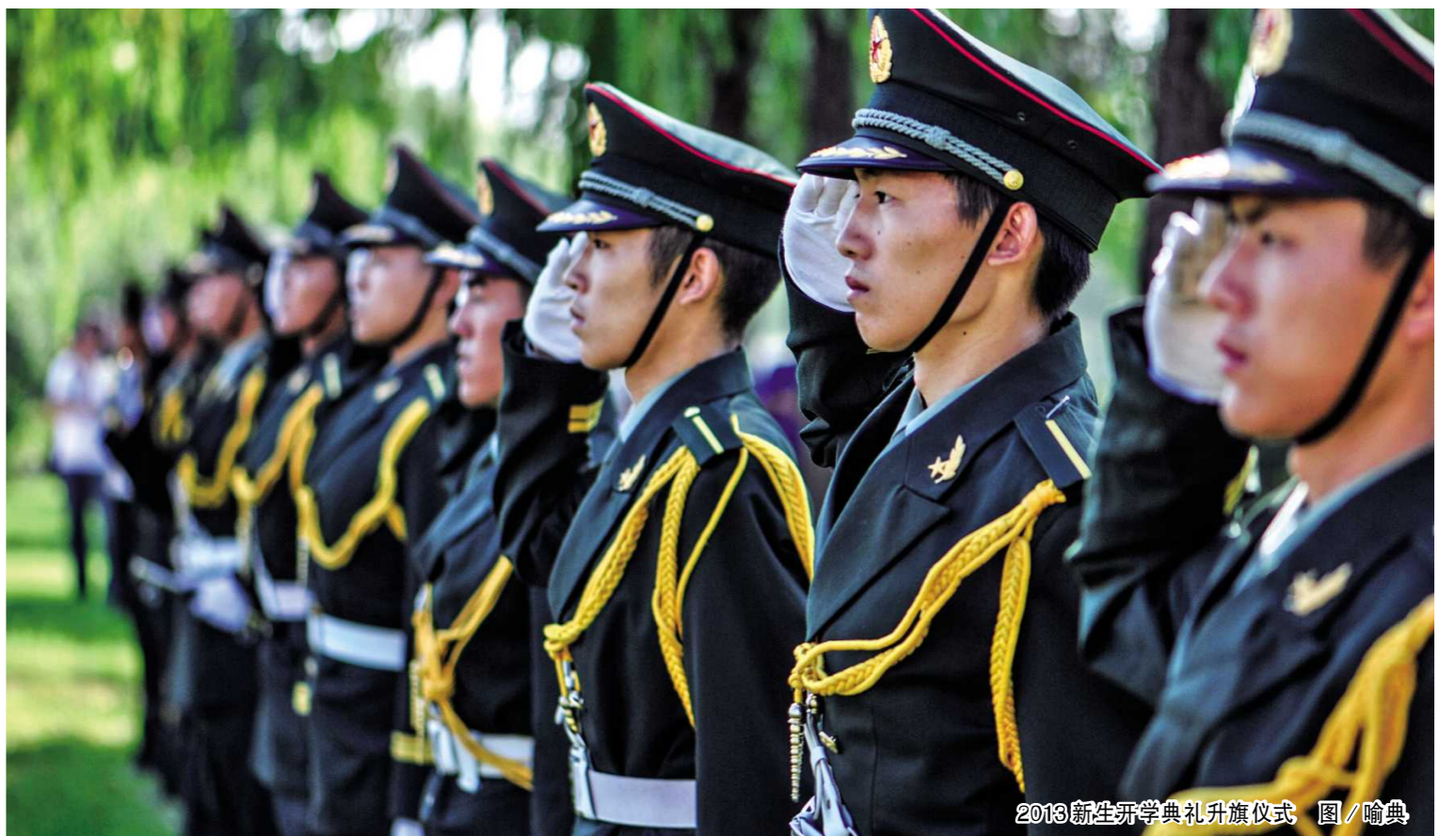
2013级新生开学典礼升旗仪式