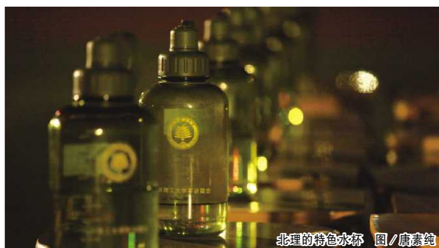
北理的特色水杯