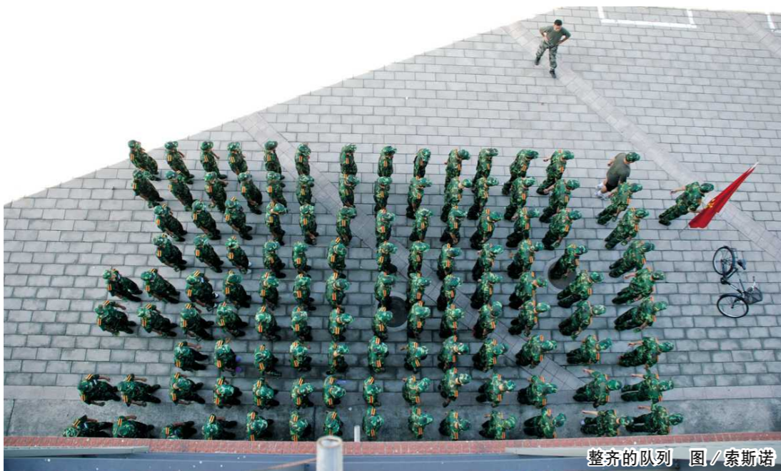
整齐的队列