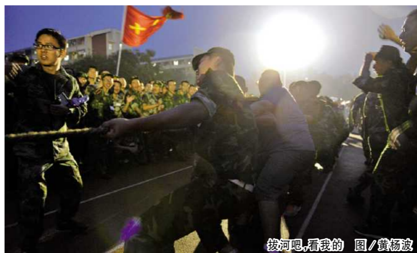
拔河吧,看我的