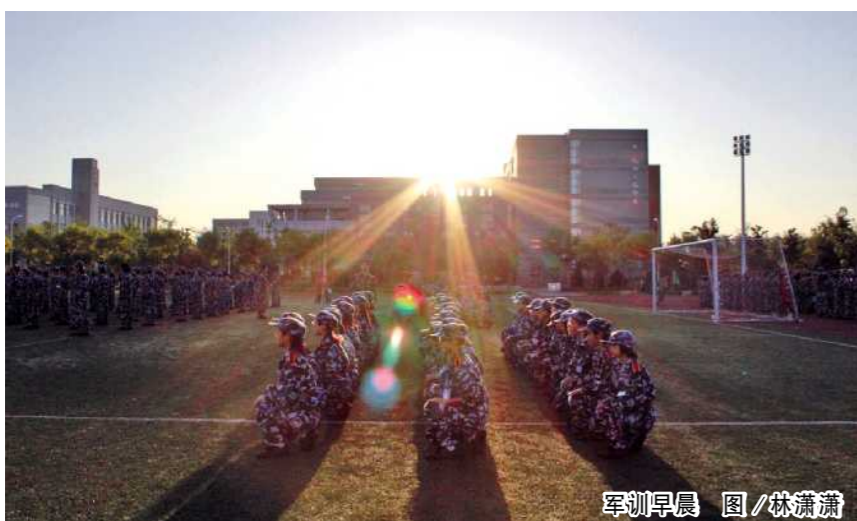
军训早晨