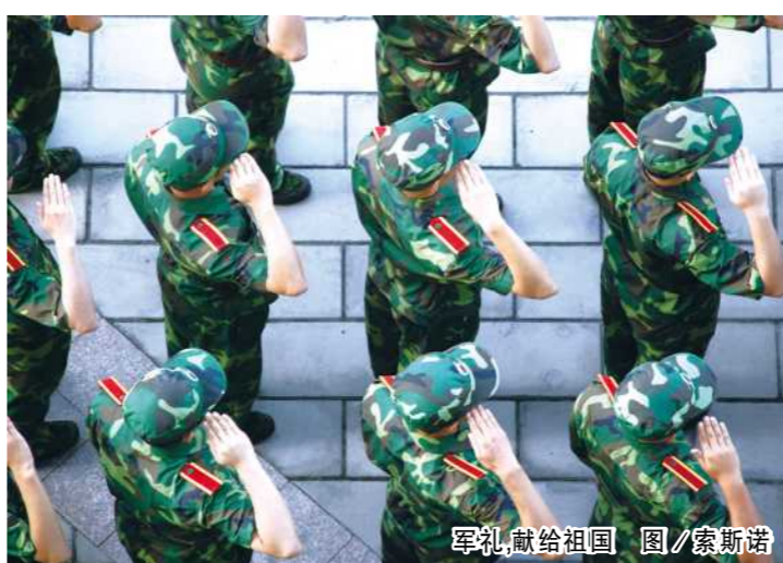
军礼,献给祖国