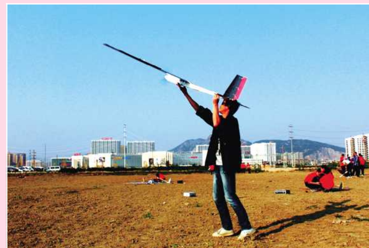
飞翔吧 北理之鹰 北理航模队