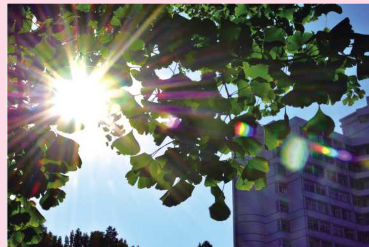
照耀吧 北理之光 摄影协会