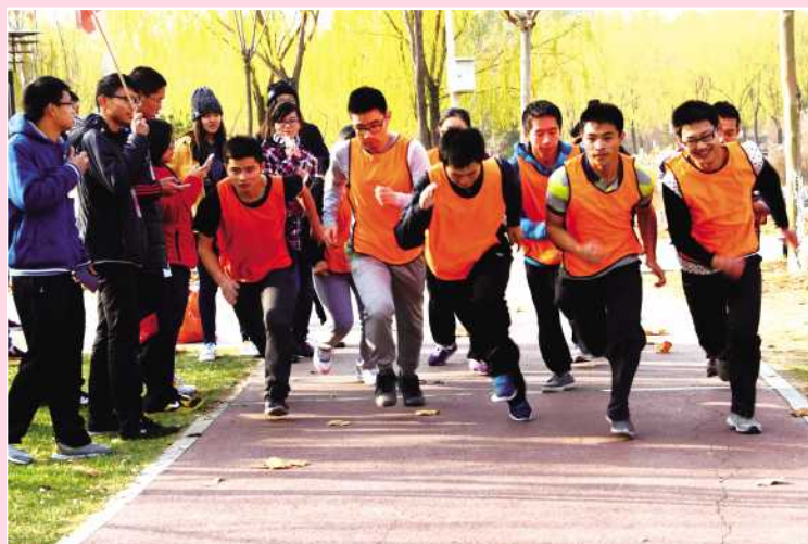
奔跑吧 年轻的伙伴! 基础教育学院