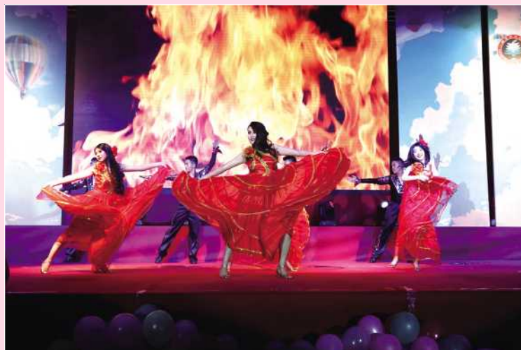
燃烧吧 火热的青春 机械与车辆学院