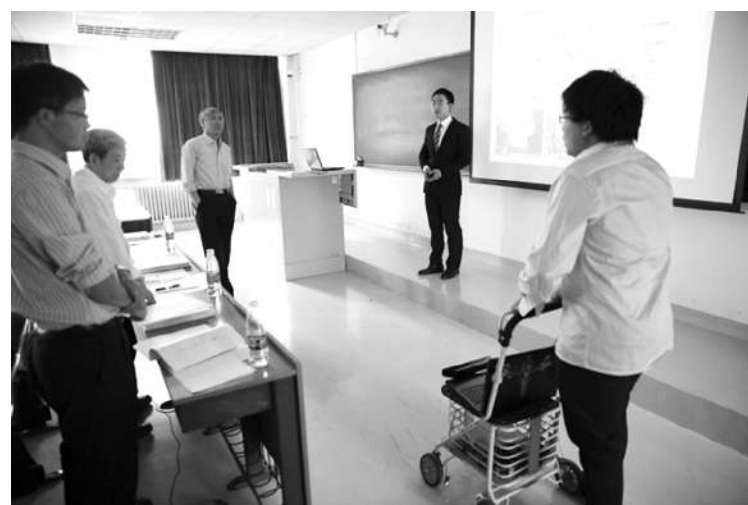
2015年5月14日,北理工2015大学生创新训练项目答辩会在信息楼顺利召开。2013年立项的72个国家及北京市级大学生创新训练项目参加了本次答辩。教务处邀请了21位具有丰富实践教学经验的专家教授担任评审委员,按项目的学科门类分组进行了答辩。

研究基础,要求项目承担单位精诚合作,在微纳制造领域取得原创性科研成果,引领行业的发展。 墨宏山代表项目主管部门强调了973计划项目的研究特点,希望项目团队扎实工作,确保完成研究任务。 周天丰汇报了项目的总体目标、主要研究内容、具体研究方案、预期成果以及现有的研究基础;项目组成员蒋永刚、张丽琼分别做了专题汇报。 与会专家就项目在实际过程中可能遇到的问题等进行了讨论与交流,一致认为该项目兼具创新性和挑战性,充分认识项目研究的难度,勉励项目团队探索基础研究和应用技术的有机结合,进一步强化各任务间的衔接,突出研究重点,通过基础研究切实解决重大实际问题。 国家青年973项目,旨在培养35岁以下青年人才,创新与科研组织能力,2015年全国共立项34项,北京理工大学获批的该项目,目前是973计划制造领域唯一的青年973项目。 (文/科研院 柏利)