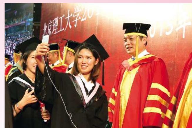
菁校园,青青岁月,感谢母校的培养,感谢恩师的教诲,感谢这自始至终,不离不弃的每一位。