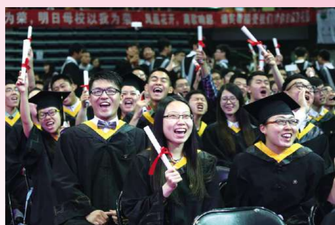
同学,是难过时倾诉的对象;同学,是快乐时分享的好友;同学,永远是在我们需要时最坚实的港湾。北理毕业季,让我们笑着说再见。