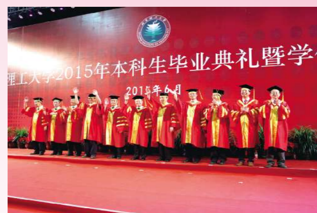
北京理工大学“第一男子天团”:亲爱的同学们,记得常回家看看!

2011年夏天,朝气蓬勃的你们带着稚嫩的笑脸来到这里,整齐的宿舍楼,雄伟的教学楼、实验室,尚未完工的北湖,还有那让人爱恨交加的良乡“中食堂”,带着军训后黝黑的面庞,四年的大学生活就这样在懵懂和未知中正式交锋。经历激情、坎坷、迷惘、奋斗和梦想,四年后的今天,你们收获成熟,收获希望,收获纯真的友情和爱情。你可以留恋,可以不舍,但请展开你雄鹰般的臂膀,继续奋力翱翔。在走出学校的那一刻,铭记“懂得付出、恪守责任”,尽一名北理人应有的责任和使命,勇于担当,维护社会良知,肩负起实现中国梦和中华民族伟大复兴的历史使命!