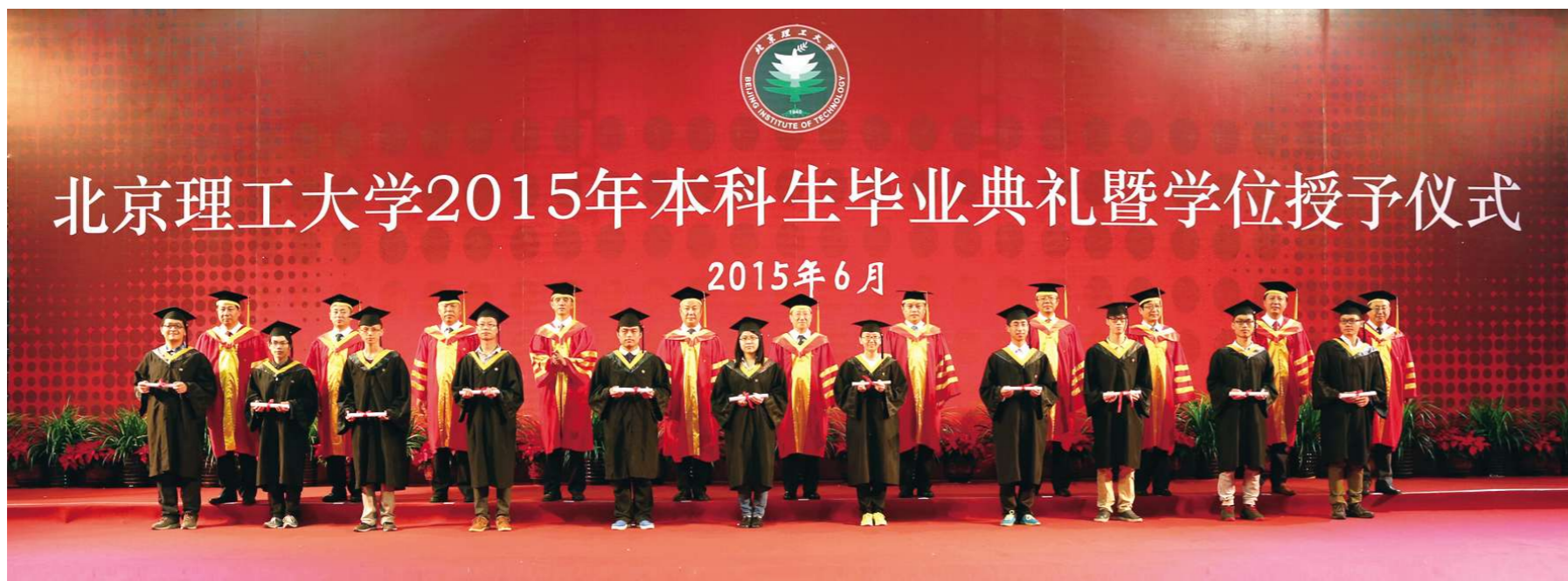
北京理工大学2015年本科生毕业典礼暨学位授予仪式