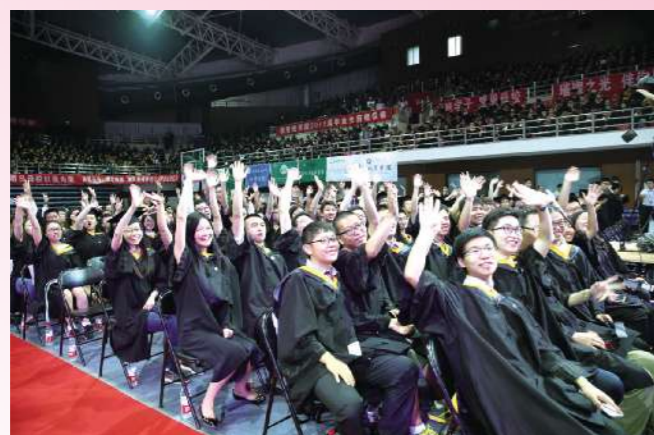
那是在北理的最后一天,结束了往日可以同时看见几百张熟悉笑脸的日子。