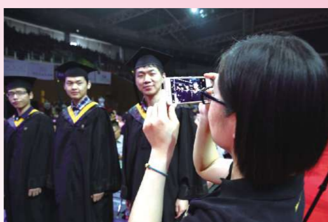
我愿意为你们记录你们最光荣、最难忘的日子,离开不是结束,我在心底默默的祝福。从来都不需要想起,永远也不会忘记。