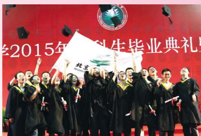
抛起学士帽,我们毕业啦!再见,北理;再见,恩师;再见,同学们;再见,留在我心底的那个你。