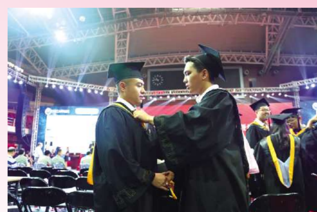
每当思绪回到和大家一起走过的北理岁月,总是仿佛能够触及到那份伴着泪水与欢笑的美好时光。无论咫尺天涯,记得北理是你我共同的印记。兄弟,保重!