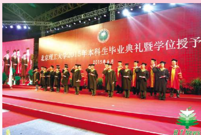
典礼上那些别样的风景,是北理海纳百川的怀抱,是母校见证五湖四海学子成才的最好宣告。