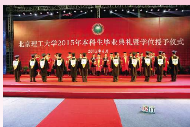
亲爱的北理,我们之所以能够胸襟挺拔、顶天立地,正因为背后有你,一路有你!