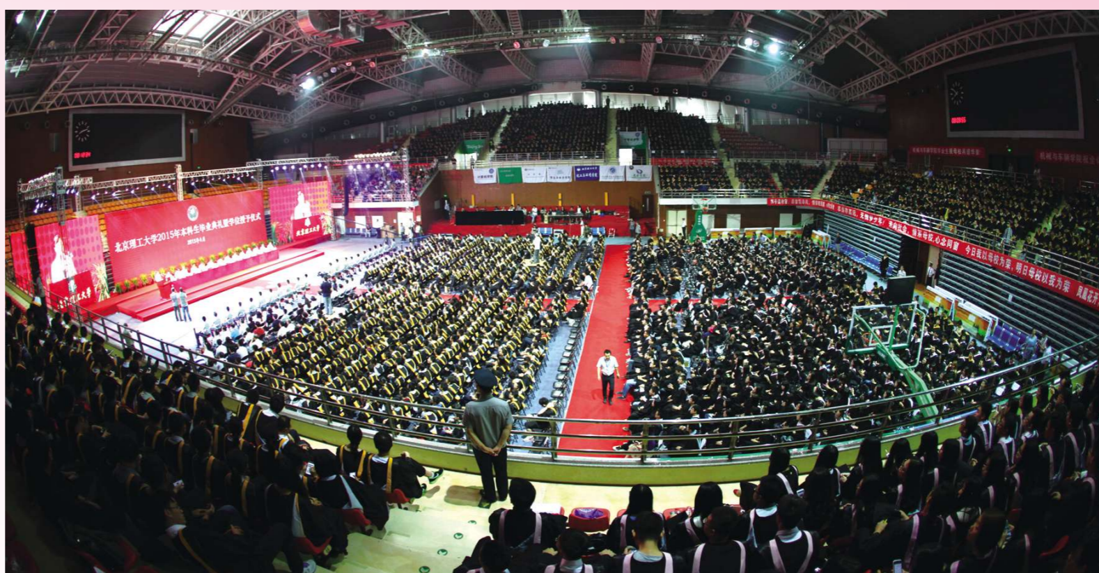
那一天,我们一起参加的毕业典礼,你知道它有多壮观吗?茫茫人海中,快来找找那一刻的你。