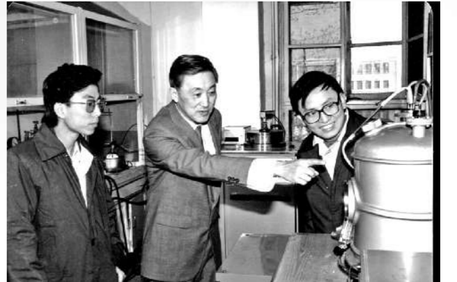
朱鹤孙老校长在实验室指导研究生进行研究

料研究领域贡献卓著。他提出并致力于生物材料与人体组织之间相互作用的研究,在细胞层面上,取得一系列创新性研究成果,曾获多项科技成果奖励,如1985年获国家科技进步二等奖,1986年获国家机械委科技进步二等奖,2005年获何梁何利基金科学与技术进步奖,并当选为国际生物材料科学与工程会士。他曾担任中国材料研究会副理事长、中国生物材料委员会副主席、中国工业设计协会副理事长、国务院学位委员会学科评议组成员、国家教委科技委军工组副组长、国家重大基础研究发展规划973项目咨询组成员、国家自然科学基金材料科学部重大研究计划专家组成员。