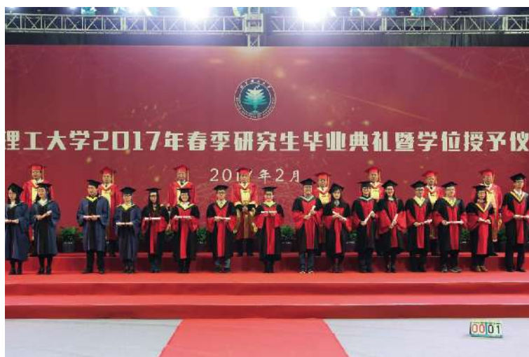
北京理工大学2017年春季研究生毕业典礼暨学位授予仪式

2月28日,北京理工大学隆重召开八届三次教代会、十三届三次工代会暨2017年学校工作会。全体教代会代表、工代会代表、院士、校领导、原校领导,处级干部、民主党派和无党派人士代表、离退休教职工代表、学生代表等近500人参加了会议。常务副校长、教代会常设主席团团主席杨宾主持了大会开幕式、闭幕式。