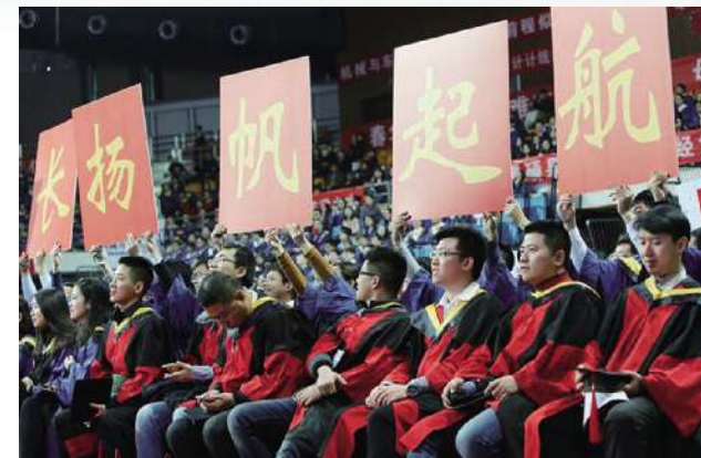
从这里出发，我们扬帆远航