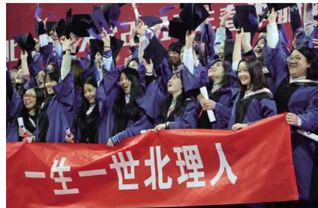
横幅上短短一行字，是母校的不舍