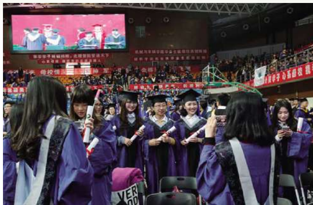
镜头定格我们自信的微笑