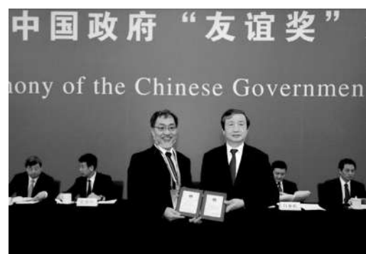
理想找到了“一流”的共鸣

在致力于微纳操作机器人研究的同时,他认为中国将会有更大空间去发展这项技术,这也是福田敏男选择来中国从事微纳操作机器人基础性研究的主要因素。他表示,现在中国有需求做真正属于自己的机器人,所以技术创新尤为重要。产业“大树”没有技术的“根须”就会死掉,船来的技术,机器人产业之树无法长青。