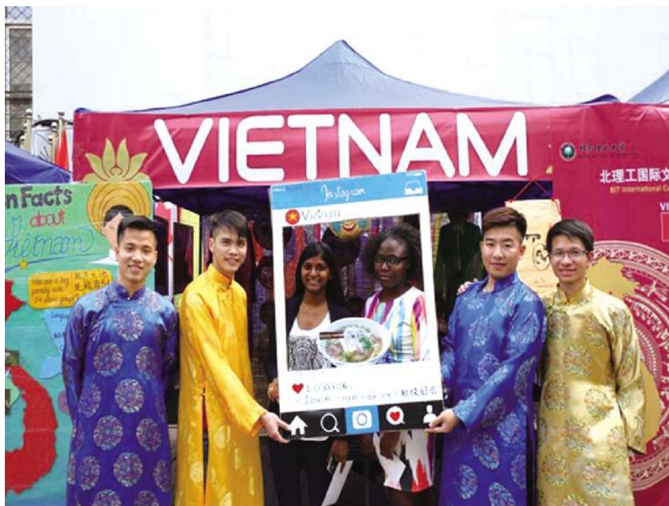
越南学生:欢迎来和我们合影