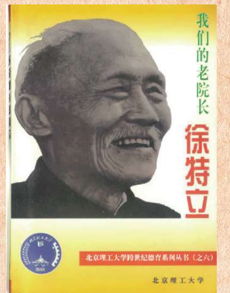
我们的老院长 徐特立

徐老的一生,是光辉的一生、战斗的一生。“他的一生就是一部教科书”。这为我们后人提供了无穷无尽的动力源泉。党中央在“祝徐特立同志七十大寿的信”中就指出:“你的道路,代表了中国革命知识分子的最优秀传统”,“把你的这一切优良高品质发扬光大是全党同志和全国人民的革命任务”。北京理工大学党委对这项任务一贯十分重视。为了纪念他,为了进一步宣传、学习、继承徐老的革命精神、教育思想和优秀品德,培养全面素质更加优良的社会主义建设者和接班人,特决定编辑这本书,使我们——曾经是