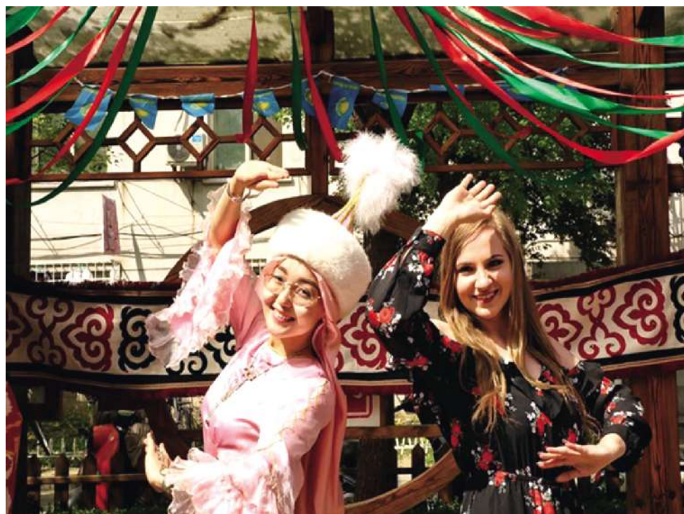
身着民族服装的哈萨克斯坦姑娘正在教观众跳舞