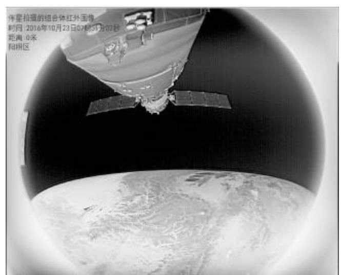
伴星拍摄的组体红外图像

这台“神”相机被誉为中国的“巡天之眼”，它创造了航天领域的多个国际“首例”“首次”：首例长波红外鱼镜头（中国发明专利，比美国早2年），首例长波红外仿生鱼眼探测系统（中国发明专利）首登天基平台，首次自主实现关键性能在轨验证，首次在轨对己方航天器