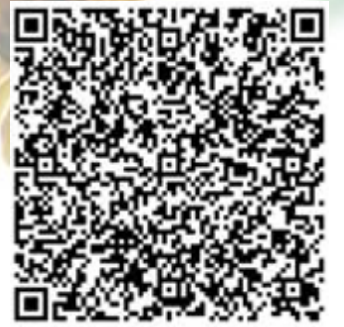
扫描二维码，阅读更多精彩内容

在灿灿的党徽旁，学生们用银杏叶还原了学校辗转办学的路线图，也还原了北理工与党和国家同呼吸、共命运，科教兴国、人才强国的初心所在。“不忘初心、牢记使命”正逐步化作鞭策青年学生前进的强大动力，激励同学们让党的十九大精神在读书报国的实际行动中落地生根。