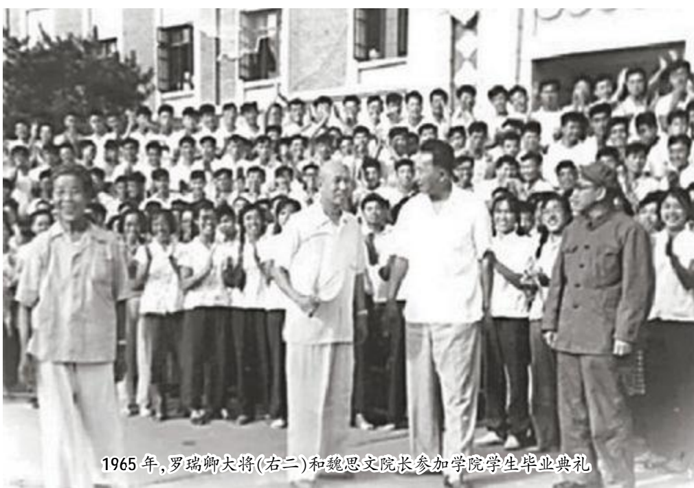
1965年，罗瑞卿大将（右二）和魏思文院长参加学院学生毕业典礼