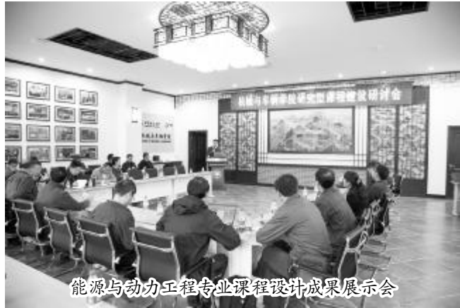
能源与动力工程专业课程设计成果展览会

这样的展示，综合体现了机械与车辆学院秉承“学术为基、育人为本”的理念及大力实施人才培养综合改革后的建设成效。学院通过实施以研究项目为驱动的专业导师制，搭建了会员全过程的育人平台，为本科生创新精神与实践能力的精细化和个性化培养提供支持，进一步加强学生的自主学习和科研创新能力培养。