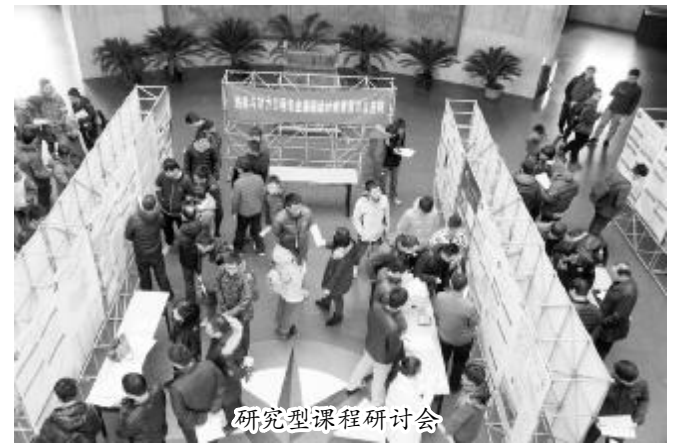
研究型课程研讨会

“以研究项目驱动的会员全过程专业导师制”的深化改革试点，得到了学校的大力支持，并对实施方案提出意见建议，机械与车辆学院将本次改革作为全院人才培养工作全面改革的突破