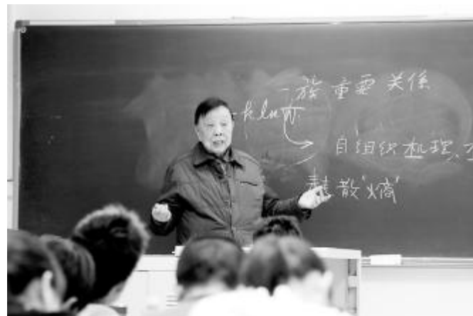
家国情怀 大志无疆

他曾领导我国军用信息技术从白手起家到蓬勃发展，他曾研制“中国第一台火控雷达 301 系统”等多项中国乃至世界第一，他曾多次荣获国家科学技术进步一等奖、全国科学大会奖等科技殊荣……这位 86 岁高龄仍坚持为本科生上课的先生，就是中国科学院、中国工程院院士，原北京理工大学校长，杰出的战略科学家、工程教育家，雷达与通讯系统专家——王越先生。