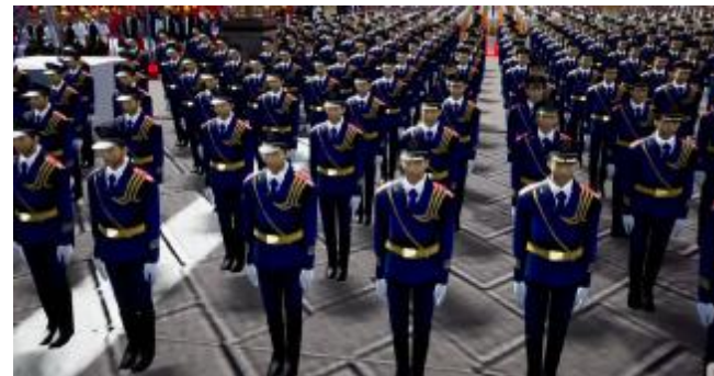
仿真系统里的人群模型

但已有的积累,并未让这位“老仿真”松口气。“10 年过去了,技术迭代了,需要也更多了,我不敢有丝毫松懈,得让大家切实感到仿真技术的效用,而不是看上去很‘高科技’。”丁刚毅说。