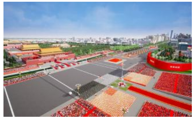
精度校准到厘米级的天安门广场

团队针对国庆日当天广场20万人规模的大型活动,协助国庆庆祝活动各级指挥部实现一系列“硬任务”,包括环境-装备-人群-事件等仿真设计与创意可视化、系统评估与方案生成、工程设计的仿真试验评估、训练-排练方案生成与创意修改、指控辅助与应急仿真、转播仿真与集结疏散设计、观礼人员服务管理仿真支持服务等。