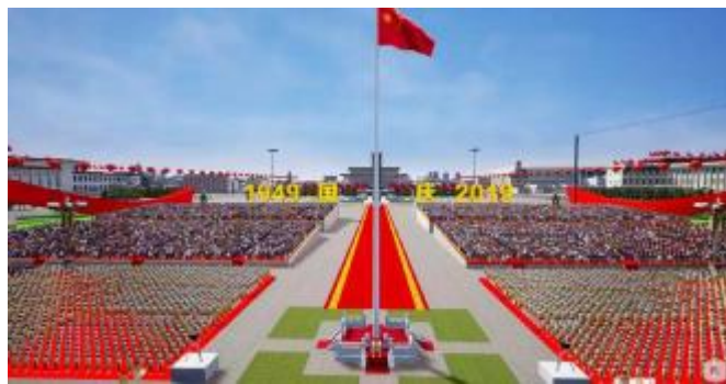
精度校准到厘米级的天安门广场

10 月 1 日,当最后一个群众游行方阵通过天安门广场,北京理工大学计算机学院教授、数字表演与仿真技术北京市重点实验室主任丁刚毅悬了一年的心,终于落地。