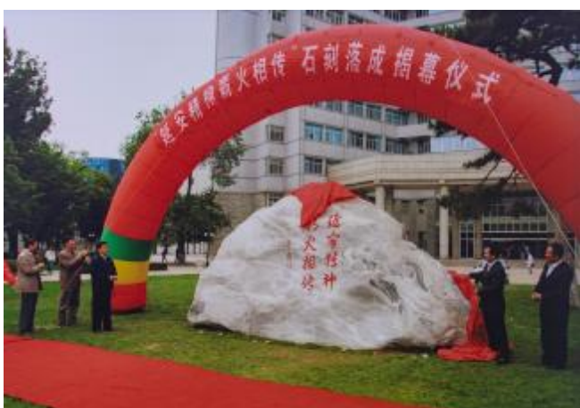
▲北京工业学院牵头研制具有先进水平的大型气象仪

我国研制成功的一台具有先进水平的大型气象仪，1984年7月14日在北京通过技术鉴定。这台安装在北天文馆的天象仪主机高5米，底座直径3.2米，重约3吨，能在半球形的天幕上放映一个人造星空，模拟多种气象。它采用以地球为固定观察点的模拟原理，提高了模拟气象的精度，在放映内容上，具有中国的民族特点。它是由北京工业学院、北京光学仪器厂、北京电视技术研究所和北京天文馆等单位共同研制的。