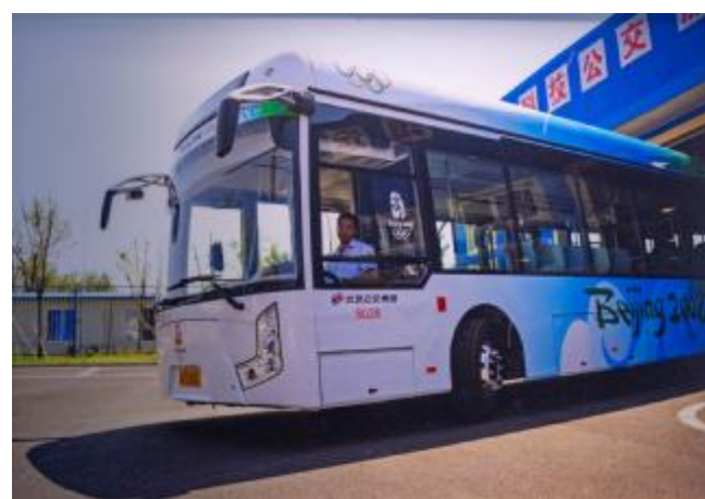
▲“零距离”接触奥运电动客车

2008年8月2日，在北京奥运会奥林匹克中心区停车场，一辆电动公交车正驶出充电站。