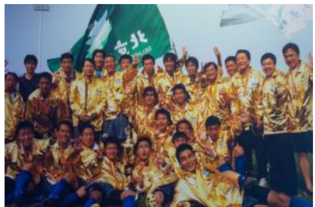
▲北京理工大学在中国大学生足球联赛夺冠

2004年6月19日，“2003-2004 飞利浦中国大学生足球联赛”总决赛在武汉举行，北京理工大学队以3比0战胜深圳大学队，获得冠军。图为颁奖典礼上队员共享胜利的喜悦。