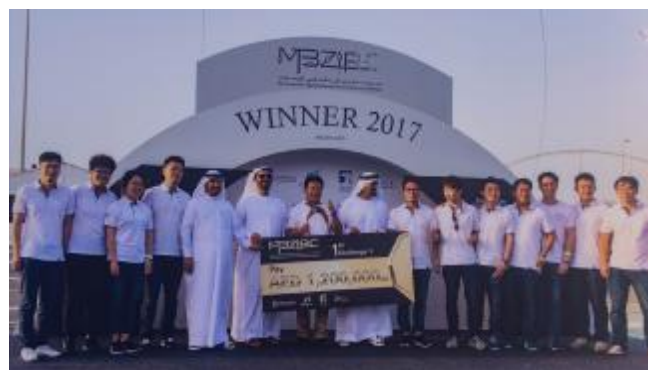
▲北京理工大学代表队获国际无人机比赛冠军

2017年3月18日，在阿联酋首都阿布扎比，获得“无人机移动目标探测及自主起降”项目冠军的北京理工大学代表队领奖。3月15日至19日，穆罕默德·本·扎耶德国际机器人挑战赛决赛在阿布扎比举行。来自中国的北京理工大学和北京航空航天大学两支代表队参加了比赛，其中北理工代表队获得“无人机移动目标探测及自主起降”项目冠军。