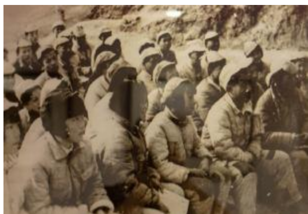
▲延安初创时期自然科学院学生在露天上课

1940年9月1日，自然科学院（北京理工大学前身）在延安举行开学典礼。时任中央财经部部长兼院长的李富春宣布自然科学院的任务是：培养既通晓革命理论又懂得自然科学的专业人员。要求学生“既是技术专家，又是革命通才。”