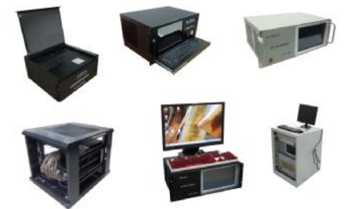
“星网测通”项目成果展示

该项目以参加项目的学生团队为第一发明人申请国家发明专利21项，授权11项，获得软件著作权8项，实现了核心技术自主可控，得到了王小谟院士、樊邦奎院士、周志成院士等多位院士及大批航天领域龙头企业的高度评价。