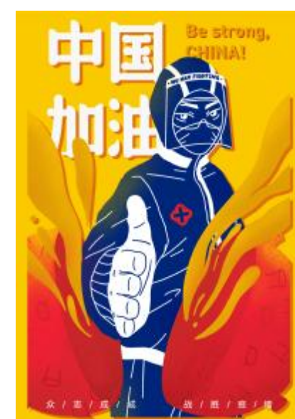
《中国加油 战胜疫情》张艺