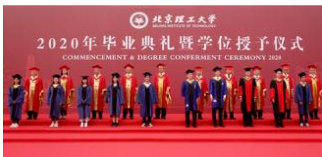
关爱融入贴心暖心的工作中。北理工全力保障2020届毕业生顺利毕业、高质量就业,“春风”送来疫情之下“最暖”毕业季。

2020年,北理工克服疫情不利影响,推出就业保障“春风行动”十大举措,全力保障毕业生就业。毕业生全员就业率95.09%,位居“双一流”高校前列。在QS全球毕业生就业力排名中,连续四年位列北京第三。学校获评北京高校毕业生就业工作先进集体。受疫情影响,学校数千名2020届毕业生未能返校参加毕业典礼。在7月8日举行的毕业典礼上,学校通过“智云学位授予仪式平台”,给毕业生们带来了第一视角的360度全景学位云授予体验,将思政教育通过“云端”送进学生心里。6月29日起,学校组织教职工为2020届6000多名因疫情未能返校的毕业生集中开展行李打包、邮寄和留置物品存放工作,把对学生的关爱融入贴心暖心的工作中。北理工全力保障2020届毕业生顺利毕业、高质量就业,“春风”送来疫情之下“最暖”毕业季。