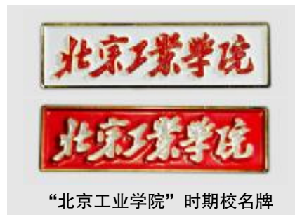
“北京工业学院”时期校名牌

经过充分调研，通过对校史资料的查阅，由于学校在迁京办学之前，处于战争年代，并未留下用于师生佩戴的学校标志的明确资料，因此，本次校庆徽章文创产品主要选取了学校历史上有据可查，且师生校友较为熟悉，曾长期佩戴的6枚徽章形象，以及纪念建校80周年主题徽章。