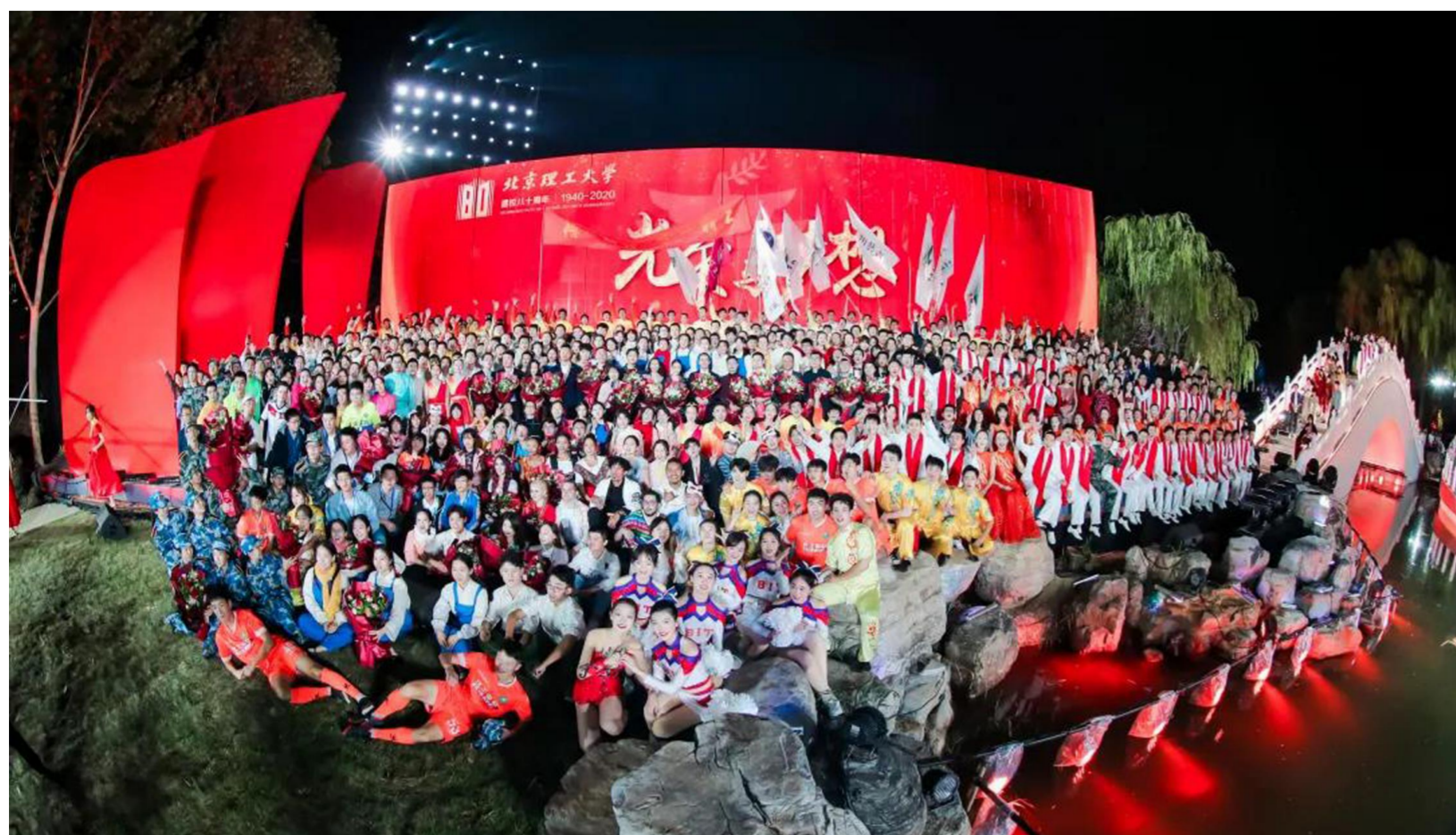
北理工千名师生共同演绎的80周年校庆“红色史诗”《光荣与梦想》。