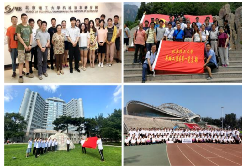
建在研究所上的党支部绽放特色光彩

科学有效的基层党组织设置方式和务实管用的工作机制,为学院党建工作奠定了坚实基础。学院党委加强理论武装,强化理论学习制度化常态化建设,每半年开展“三级联动”理论学习机制落实情况检查,全面评估学习成效;凝练人才培养综合改革和人才培养大讨论成果,编辑出版了《奋进而成——北京理工大学机械与车辆学院师生文集》《智汇北理、创梦计划》图书2部,收录了近百篇党员理论研究成果,细致展示了师生党员理论学习收获与体会,生动展现了师生投身学院、学校发展建设的信心和决心。