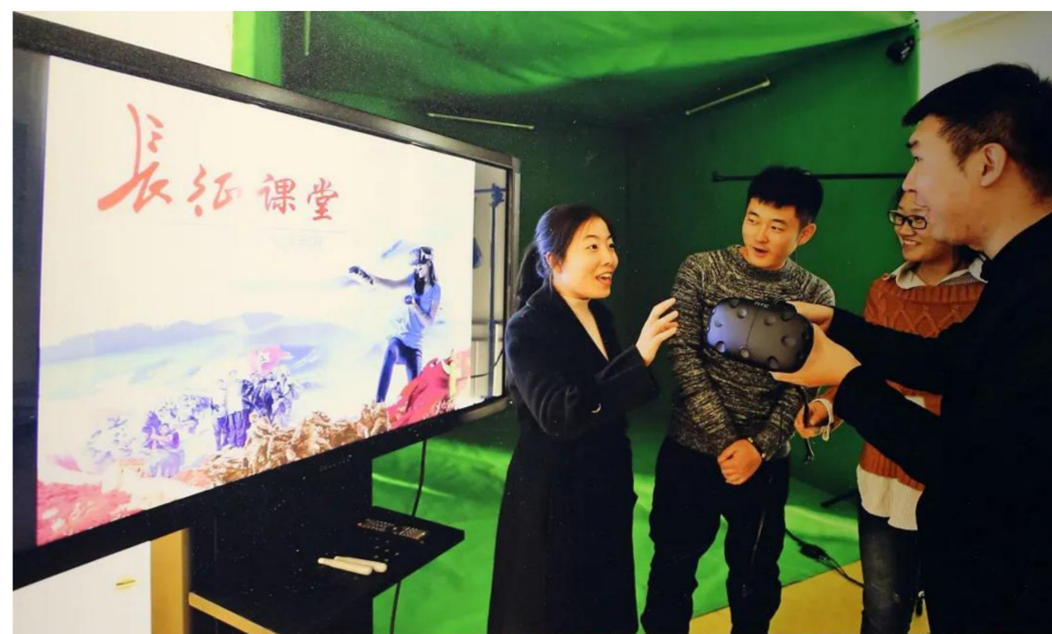
北理工将虚拟现实（VR）技术运用于思政课堂。