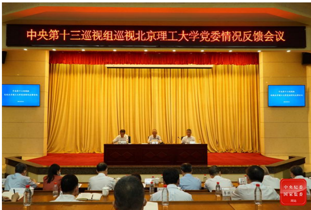
中央第十三巡视组巡视北京理工大学党委情况反馈会议

网址:https://www.bit.edu.cn/xww/blxbnew/index.htm 投稿邮箱:xcb@bit.edu.cn