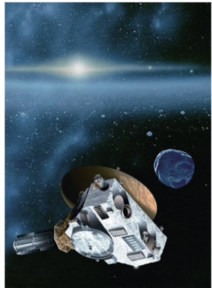
图 3 “新视野号”外观艺术效果图 Fig. 3 The artist's picture of New Horizon space craft

“新视野号”的推进系统由 16 个单元肼推进器组成,其中 4 个推力为 4.4 N 的推进器主要用于修正飞行轨道,12 个推力为 0.8 N 的推进器主要用于使探测器自旋加速或减速。“新视野号”共携带 77 kg 推进剂,用于在航行过程中修正轨道或改变