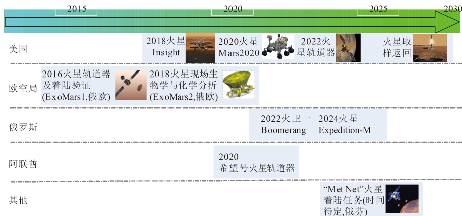
图1 国际火星探测任务规划

近年来，世界航天大国纷纷制定了各自宏伟的火星探测规划 [4-7] ，并开始分阶段实施，如图1所示。