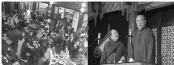
图4 天津老年人茶馆相声公共文化消费形态