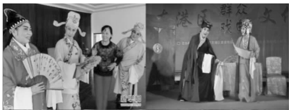
图3 天津老年人剧院戏曲公共文化消费形态

由于受到传统戏曲文化的熏陶,大多数天津人都非常喜欢这种吹拉弹唱的技艺,尤其是经历了数十年的耳闻目睹的切身体验,老年人更加热衷于这种传统文化形态。据统计数据显示,截止2013年年底,天津市以老年群体为主的注册或非正式注册的曲艺团体约有几十个,老年人成为戏曲文化的消费主力之一的同时,也成为剧院戏曲文化的主要传承者。如图3所示,退休后的老年戏曲爱好者或者曲艺工作者经常出现于各大剧院、戏园或演艺场所,编排演出名曲名剧,自娱自乐。这样,既满足了老年人精神文化生活的需要,在传统文化遗产保护与发展中也起到了传帮接代的作用。