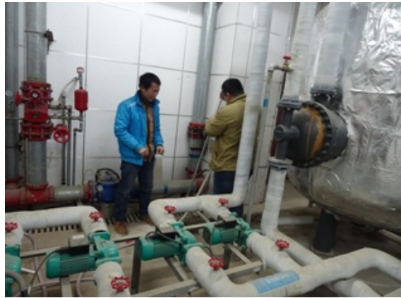
留学公寓交换站安全隐患处理