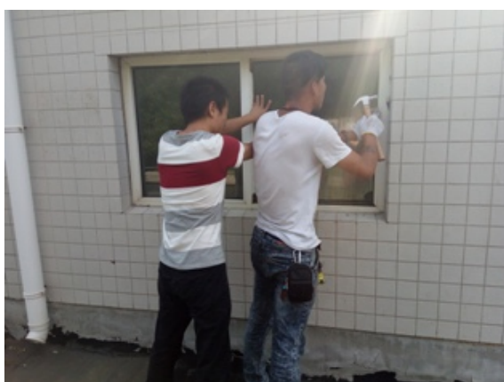
锅炉房房顶窗户维修