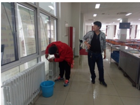
一号食堂更换跑风