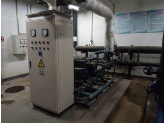
生态楼交换站制度张贴