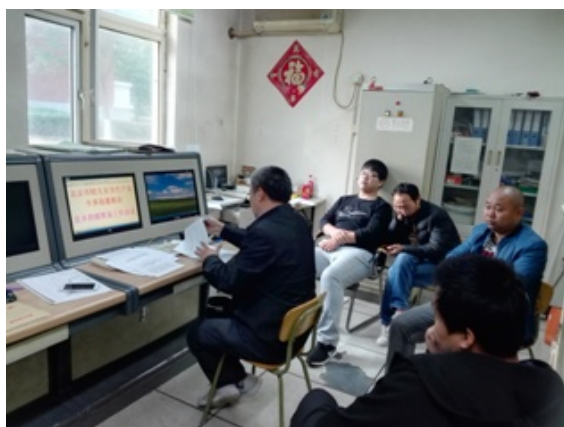
安全学习（顺义两起较大事故）

为了迎接党的十九大顺利召开。2017 年 10 月 12 日，良乡供暖供热服务部（锅炉房）所有人员集中学习了《北京市人民政府办公厅关于顺义区近期两起较大生产事故的通报》和《北京市海淀区安全生产委员会关于深入推进安全生产大检查强化事故防控的紧急通知》两份文件。并且，我们对良乡工作区内的所有设施、设备进行了隐患排查。对环境卫生进行全面清理与整治；工作制度、警示标识标语张贴上墙；消防设备检查更新；对正在进行供热设备改造、锅炉更新的单位进行告诫。将良乡锅炉房管辖区域不安全因素降到最低。为祖国、为北京理工大学后期集团贡献自己的一份力量。