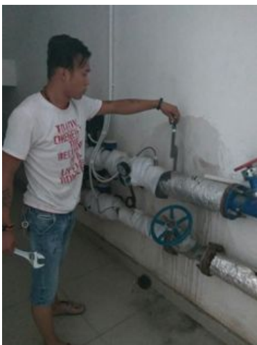
丹B更换弯管、压力表