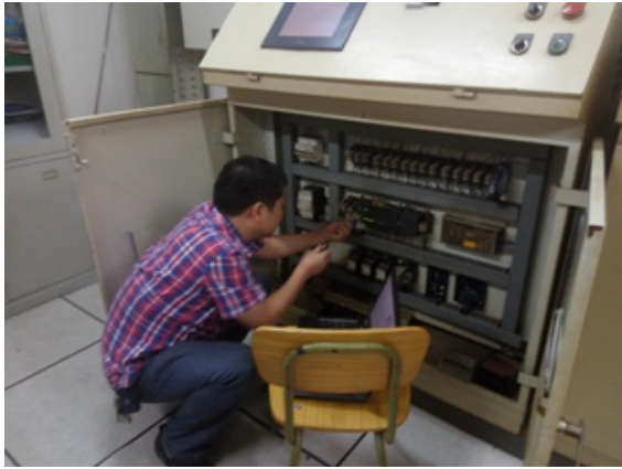
更换 2#锅炉 PLC