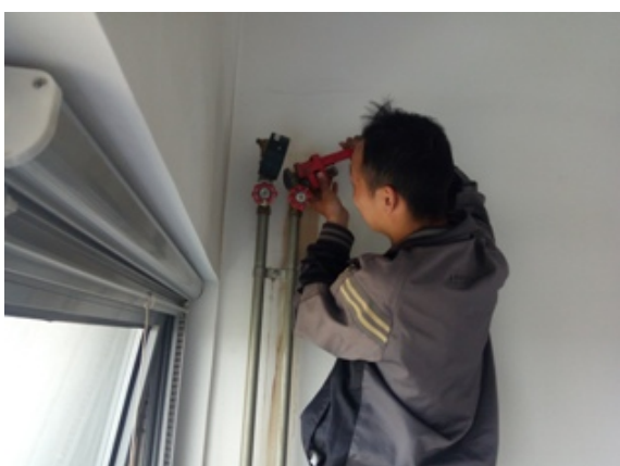
生态楼更换放气阀、压力表