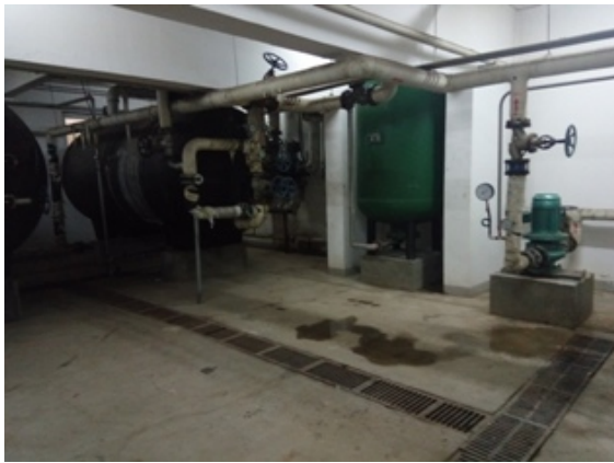
疏桐园 D 交换站卫生清理