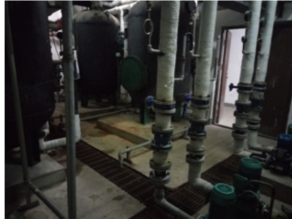
博雅园交换站设备安全排查