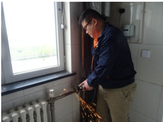
丹 B 暖气管腐蚀严重

丹枫园部分暖气管腐蚀严重。特别是厕所、水房、洗浴间的暖气管，因环境长期潮湿、腐蚀严重，存在供暖隐患。我班组对丹枫园 B 栋七、八、九层，C 栋六层楼道暖气管进行了更换。