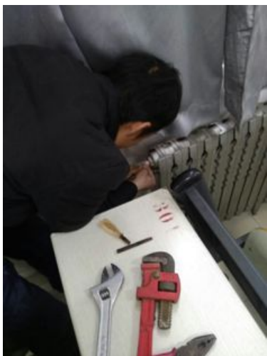
2号教学楼更换跑风