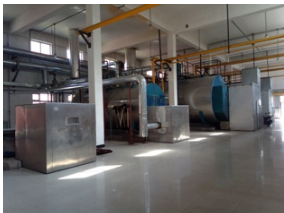
锅炉房环境、设备安全治理