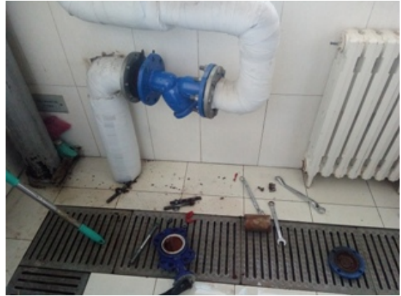
新装 DN100 洗澡水阀门