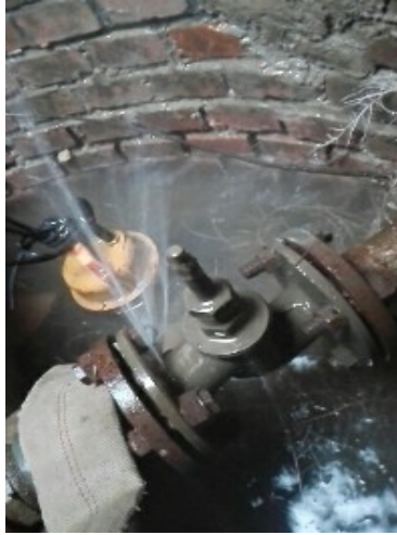
静园 D 西阀门漏水