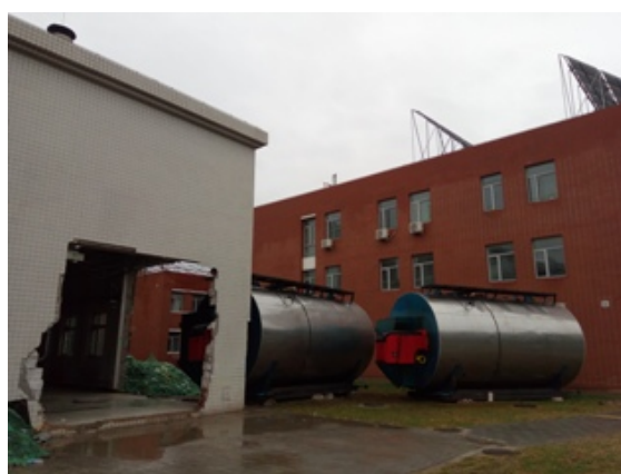
移出 2 台旧锅炉