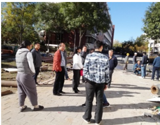
监理 后勤集团 管理处检查施工进度