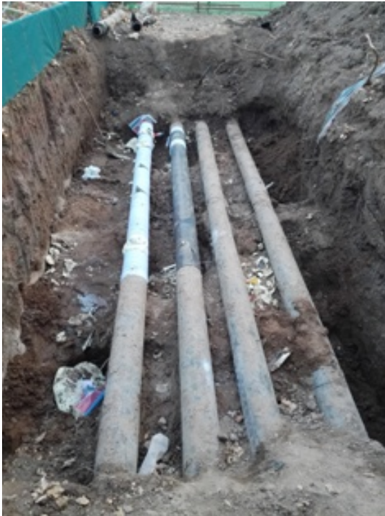
网球场西侧至善园供热管道