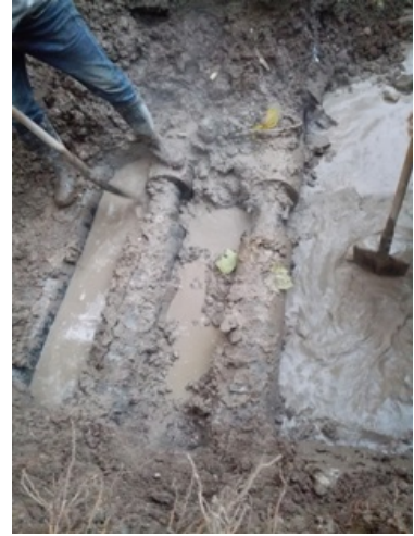
1 号食堂东北角供暖供热管道