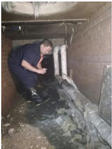
管道、阀门腐蚀严重

清真食堂地下暖气管道因环境潮湿，腐蚀严重。10 月份，后期集团对地下管囊的暖气管道进行了更新改造，为清真食堂良好的供暖提供了有利的保障。