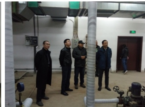
后勤集团工程验收