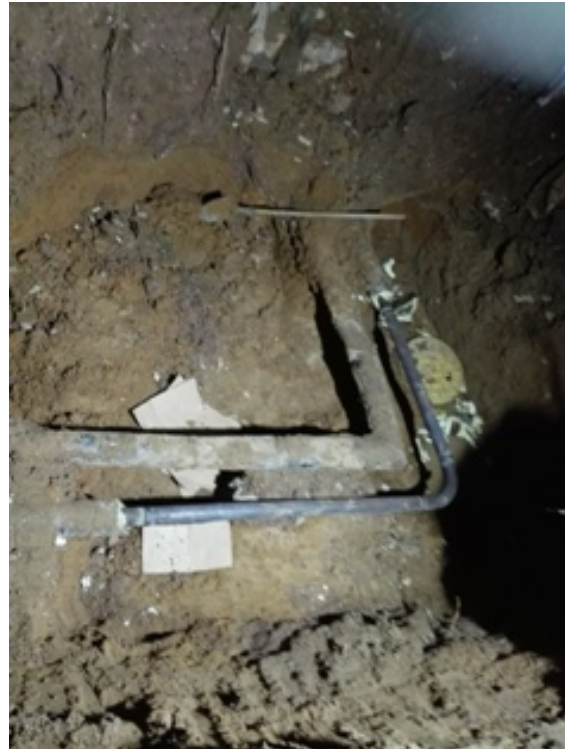
静园 C 供暖管道