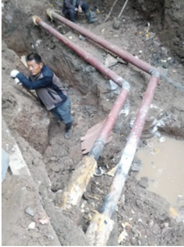
博雅园西北角供热管道