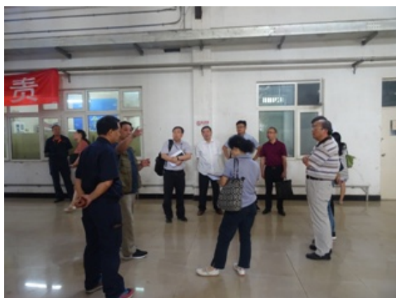
6 月份锅炉房现场调研

10 月底至 11 月初，在各相关单位的通力配合下，完成了 2 台锅炉的整体更新改造。11 日晚上良乡校区所有楼宇顺利的送上了暖气。在此，感谢支持良乡供暖的所有人，你们是供暖最可爱的人。