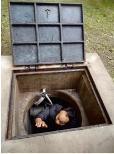
检查井沟管道与阀门