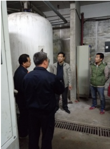
静园 D 施工