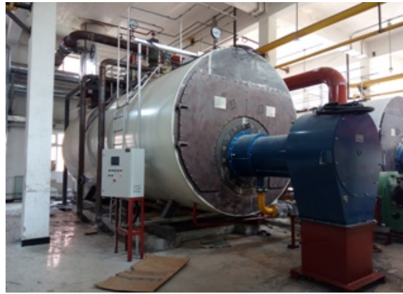
3号、4号锅炉施工基本完成