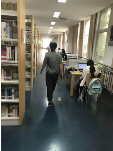
1、图书馆保安员认真巡查、仔细的检查证件。