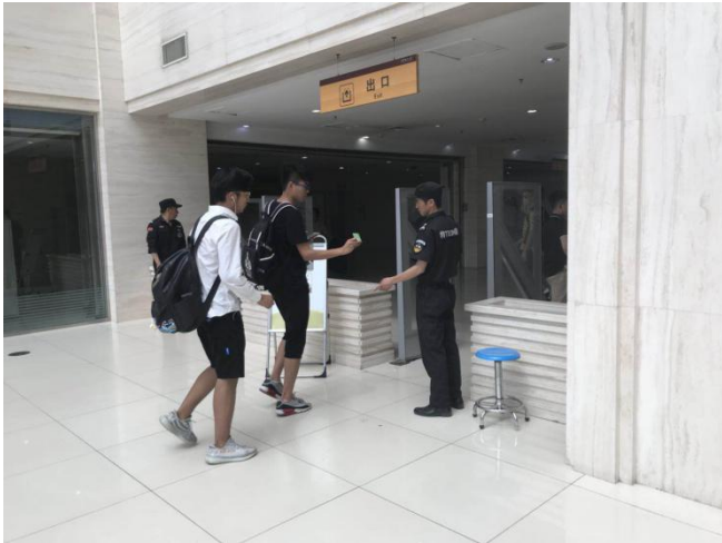
2、夏季高温下门岗坚守岗位。