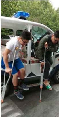
3、帮扶学生，每天接送受伤的学生去上课。