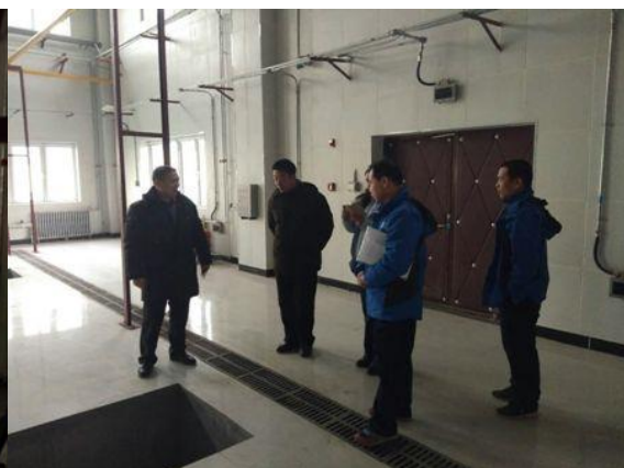
物业管理与后勤服务公司领导来东区锅炉房现场巡查