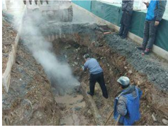
静园北侧（锅炉系统管路）