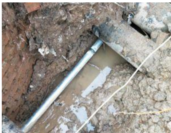
静园 D 西侧 (洗澡管路)