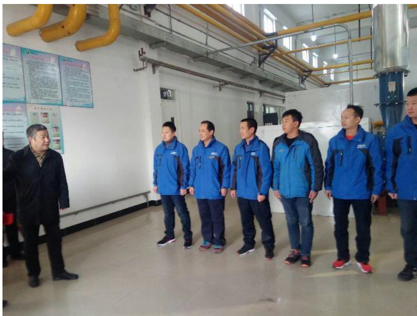
供暖供热服务部员工热烈欢迎校领导来锅炉房慰问

2019 年 2 月 4 日上午，校党委书记赵长禄、副校长龙腾、校长助理汪本聪等领导，来到良乡校区锅炉房慰问供暖供热服务一线员工，给大家带来了新年的祝福和慰问品。锅炉房员工热烈欢迎各级领导，并表示全力做好寒假期间供暖供热服务保障工作。