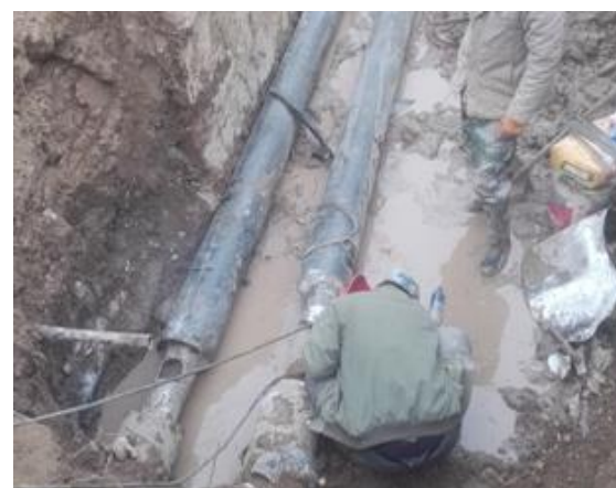
网球场西南角 (锅炉系统管路)