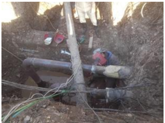
北区花园（锅炉系统管路）