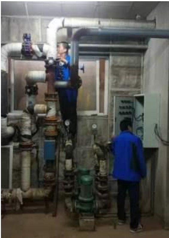
切换太阳能供热模式（起用）