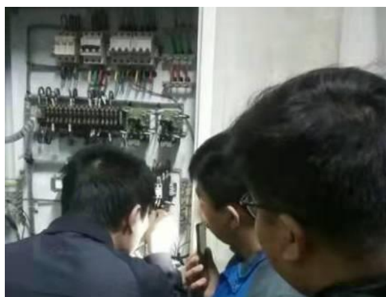
静园 D 地下室暖气漏水 拆装维修