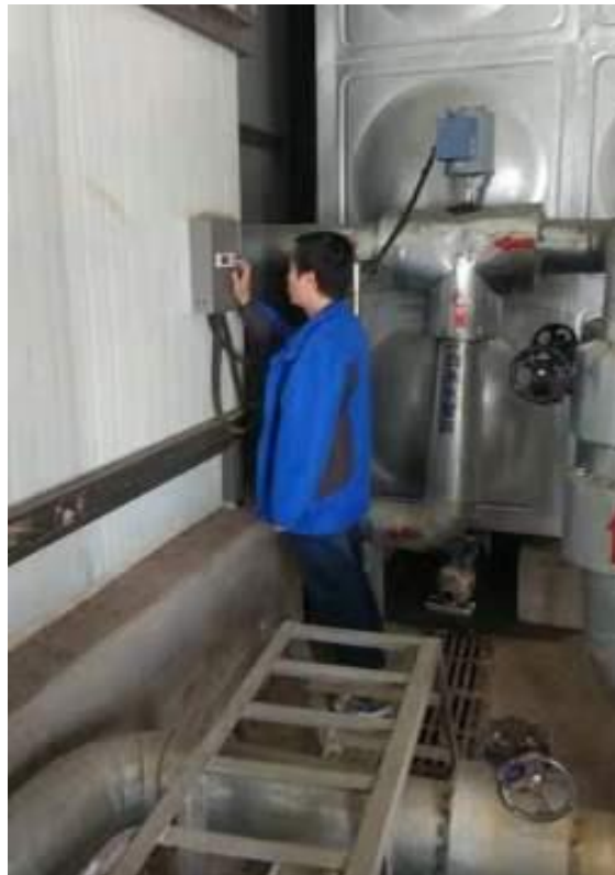
太阳能控制系统调试