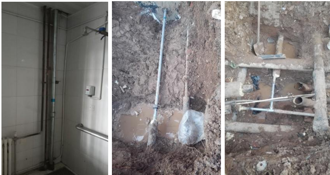
丹枫园 A 浴室管道 静园东洗浴入户管道 静园西洗浴入户管道