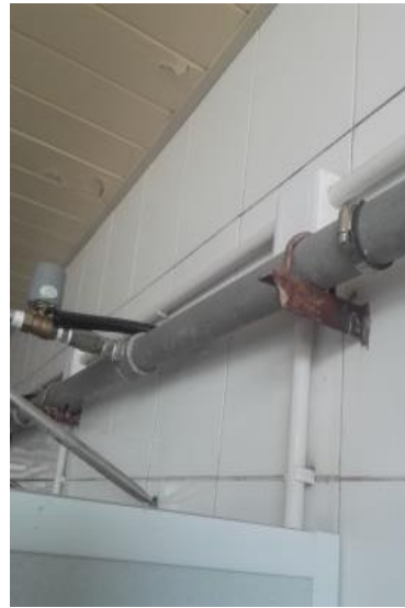
疏桐园 E 四层浴室