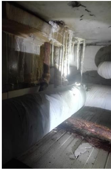
疏桐园 E 地下浴室