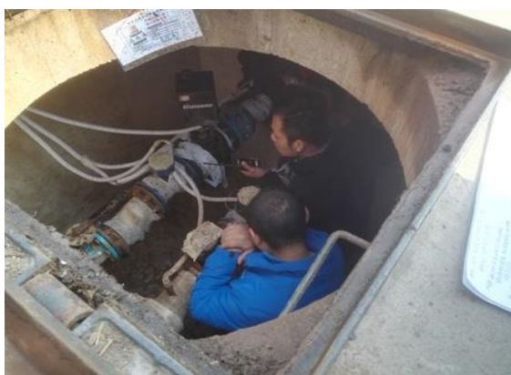
调试节能电动阀工作状态

2019 年 3 月物业中心供暖供热服务部良乡校区运行班对辖区 59 套节能井的供暖设备，进行了实地全面摸排熟悉工作。对节能设施设备具体位置、工作状态和现有或即将面临的问题进行了了解，为下一个供暖季的节能减排工作做准备。