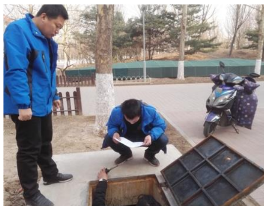
记录节能设备参数