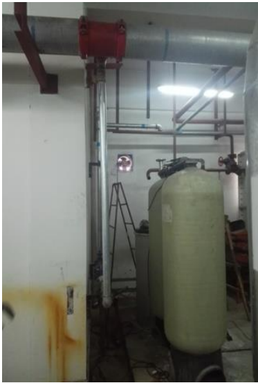
动力中心自来水入户