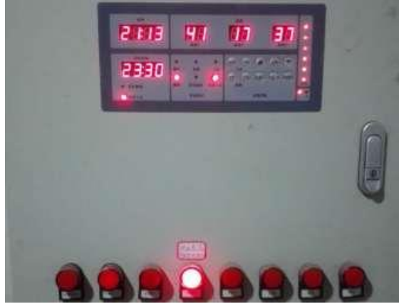
太阳能控制柜设置参数