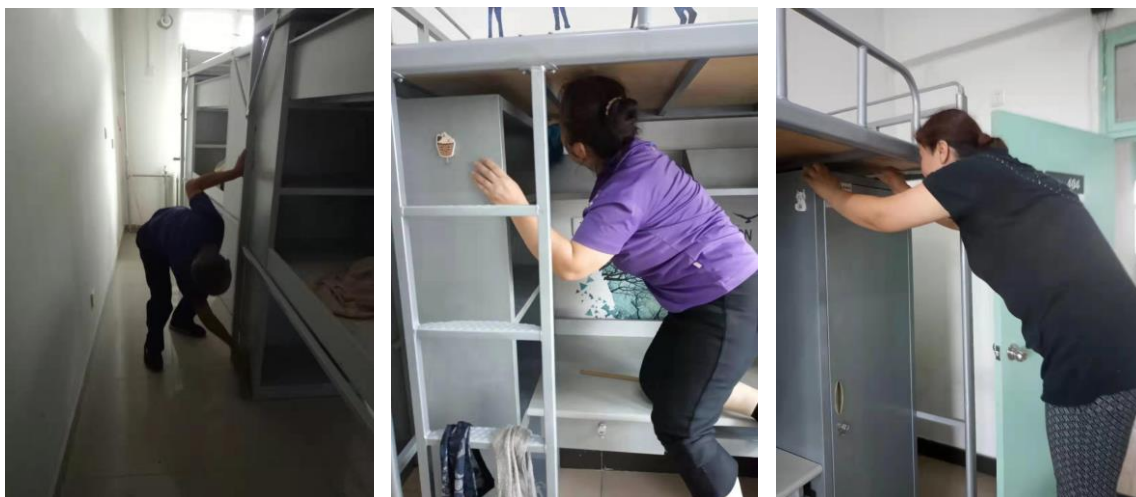
新生宿舍第2次卫生细化