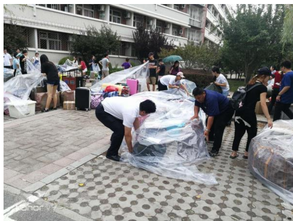
物业工作人员现场帮助学生搬家工作