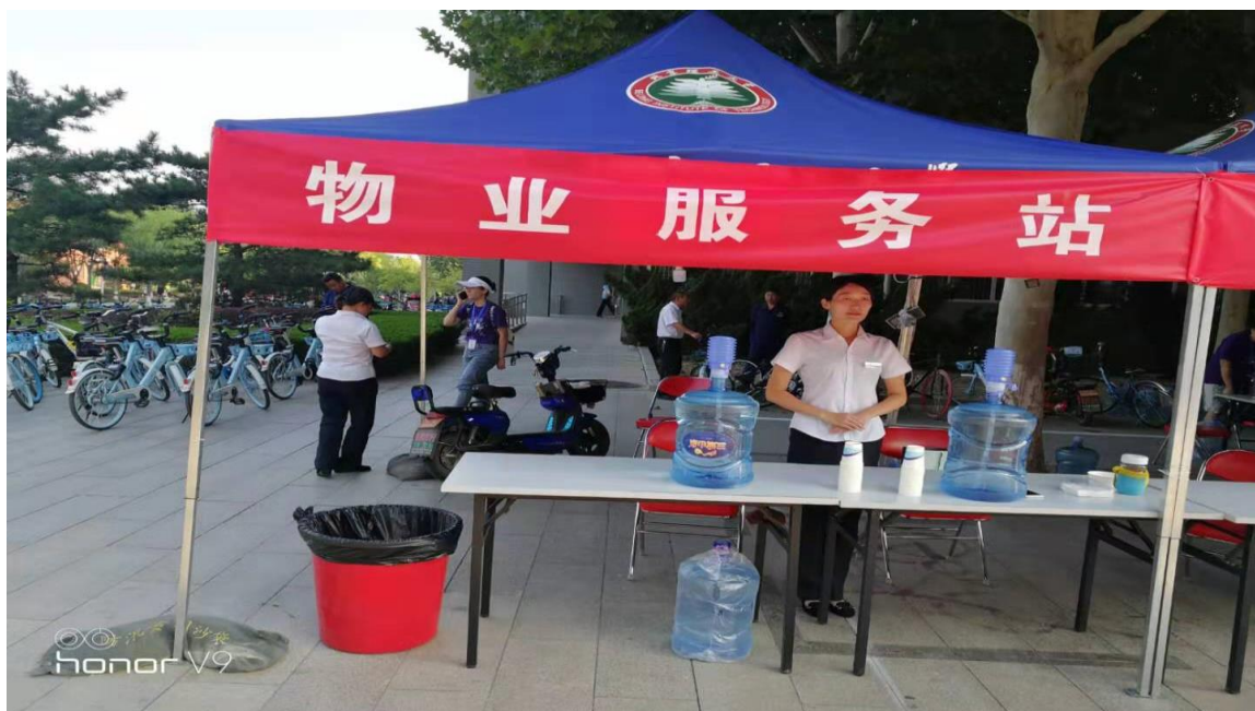
综合管理部迎新现场服务保障

2019 年 9 月 3 日迎新当天，物业综合管理部进行现场服务保障，为广大新生及家长提供饮用水及报道指引工作。