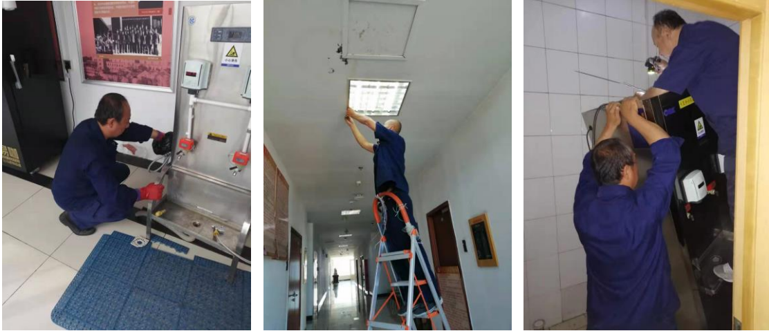
基础设施设备维修维护

2019 年 9 月物业工程部零维修共计 2415 单，包括对公寓、教室及公共区域维修。