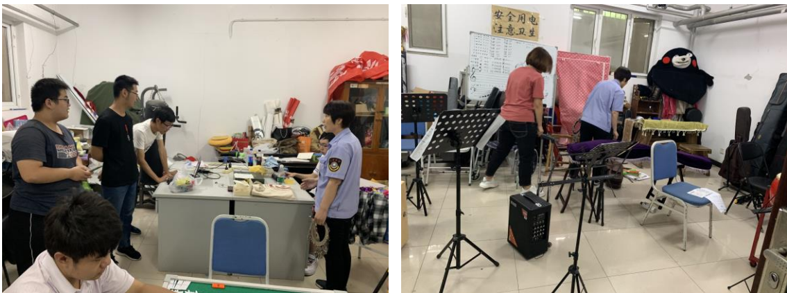
公寓管理部节前安全检查

2019 年 9 月物业经理组织各个部门主管在中秋节前对所有机房、地下室、进行安全检查，消除安全隐患。