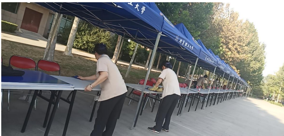
迎新场地布置和卫生清洁