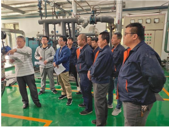
讲解压力表弯管冲洗方法