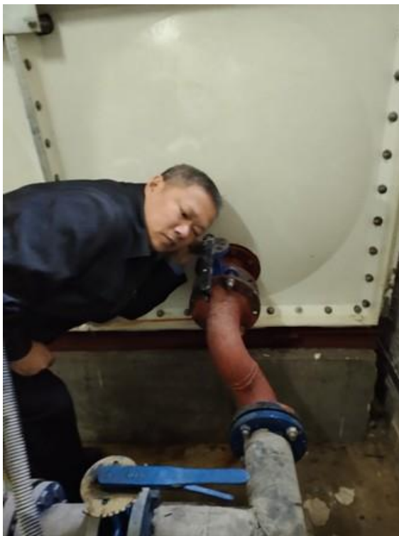
排查补水泵附近管道是否堵塞

测补水泵电机、水泵运行正常。经过仔细排查，发现为补水泵进出口单流阀和阀门同时关不严，形成小循环所致。经报领导批准后对水箱出水口处 1 台 DN100 蝶阀，2 台补水泵前、后 4 台 DN45 蝶阀，2 台 DN45 止回阀进行了及时更换。补水泵附近管道腐蚀严重，同时也对补水泵附近管道进行了焊接更换。在当天全部恢复正常补水，保证了上述楼宇上水试压顺利进行。