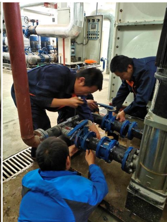
拆除、安装补水泵进出口更新阀门