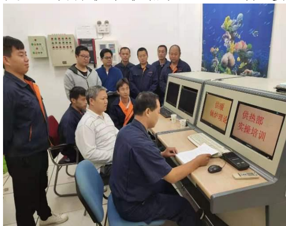
锅炉操作理论培训

通过此次培训学习，大家受益匪浅，更加提高了安全与服务意识，强化并学习了许多专业知识。最后，大家一致表示一定不辜负领导殷切希望，确保供暖供热安全、经济运行，为全体师生提供优质的服务。