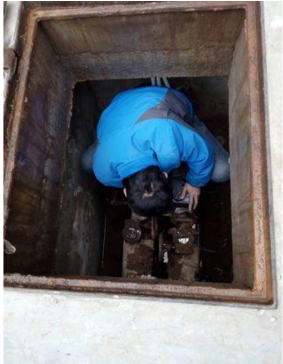
巡查节能平台设备