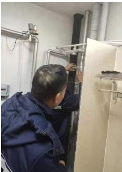
管道砂眼滴水、临时处理