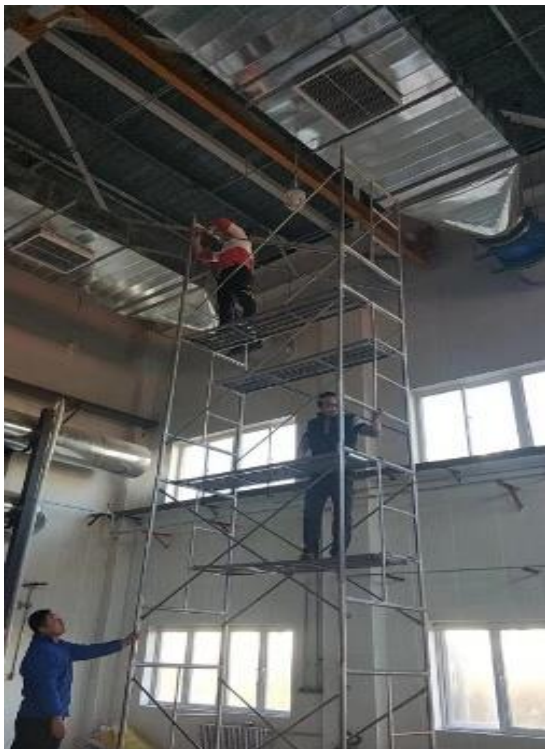
东区锅炉房照明维修

进入 12 月份、各种调试、放气工作都已完成，供暖正常。我班组对上个月积压而又不影响正常供暖供热零星遗留问题，进行了维修处理。