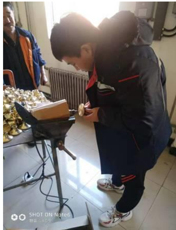
喷头二次加工（扩孔）