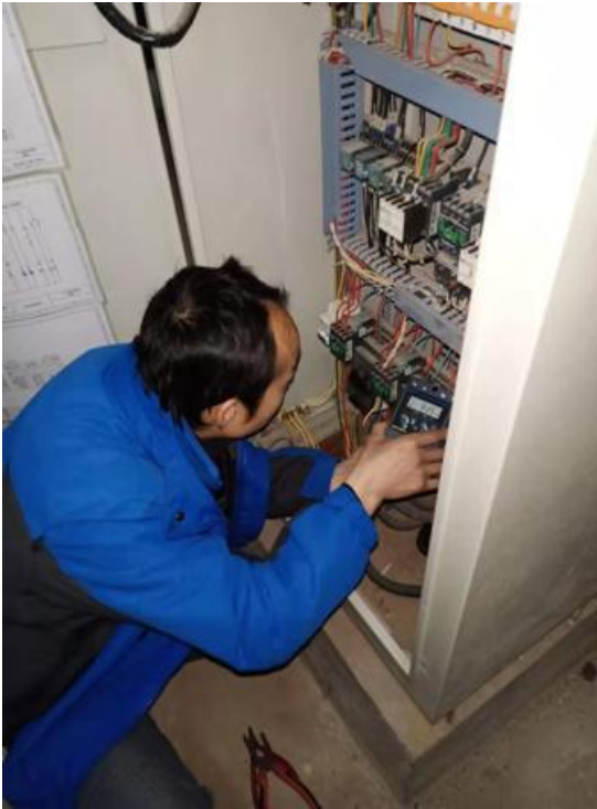
配电柜更换定时器