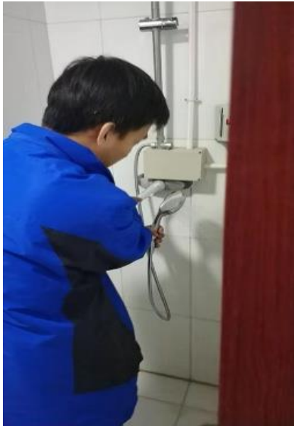
留学生公寓更换喷头

内全部维修完成。比如，喷头支架不牢固；终端水管堵塞水小；终端小管道、阀门、喷头损坏或跑冒滴漏水等问题。