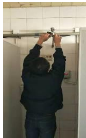
静园 D 更换喷头