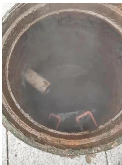
污水井有热水流入

12 月 11 日上午 8 点多，我班组巡查图书馆时，发现图书馆北侧，管道有漏水迹象。班组技术人员立即到场，发现北侧排水井中热气冒出，经过我们分析与技术排查，基本判断为通向图书馆的进户一次水管道漏水，立即上报领导。随后，协调安排施工方抢修。下午 16:00 点多挖到漏水点，确认为一次水管道漏水，漏水原因为管道严重锈蚀。为了保证图书馆夜间设备不被冻坏正常供暖，我们班组要求施工方采取临时措施，维持到第二天白天再进行抢修。12 日白天我班组协助施工方抢修，于下午 15 时按预定时间完成焊接修复工作，恢复正常供暖。