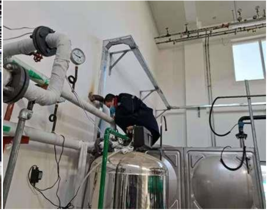
水质(除氧)设备检修