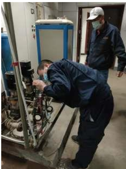
调整远传压力表参数

自 10 月 31 日良乡校区供暖系统冷态运行以来，我班组积极进行供暖调试。供暖前期调试过程中，有三项主要工作。第一、供暖前期供暖系统排气，工作时间紧；工作量大；范围广；入户难。第二、管道腐蚀漏水（跑、冒、滴、漏）工作，必须及时抢修处理。第三、设备故障与供暖系统循环不畅。在此期间，所有员工不辞辛苦，日夜奋战，在 11 月 3 日按期实现供暖点火试运行。为全体师生交了一份满意的答卷，为正式供暖奠定了良好基础。