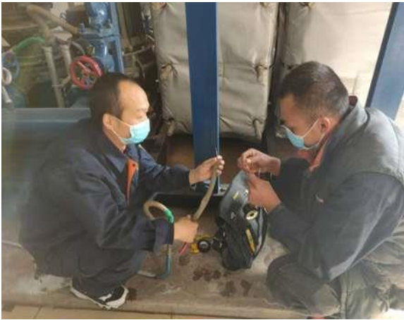
更换1#交换站电磁阀