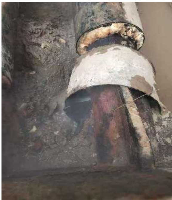
管道与补偿器腐蚀漏水

11 月 10 日上午 10 点，良乡校区运行班巡查到疏桐园 A 栋东侧时，发现管道有漏水迹象。经过检测、分析、排查，判断为生活热水一次水管道漏水。良乡校区运行班经后勤服务公司物业服务中心上报基建处，立即安排抢修。我班组配合物业服务中心协助基建处，抢修队伍制定抢修方案，尽可能利用非生活热水运行时间进行施工，将供热不利的影响程度降到最低，最大限度为广大师生提供便利。