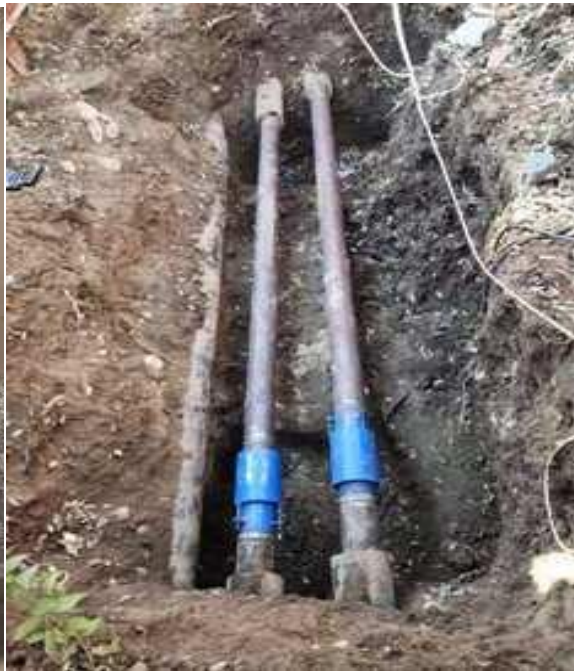
漏水管道与补偿器更换完成