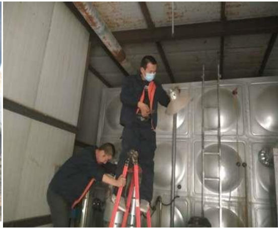
更换太阳能交换站灯泡