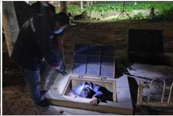
夜间排查供暖井故障