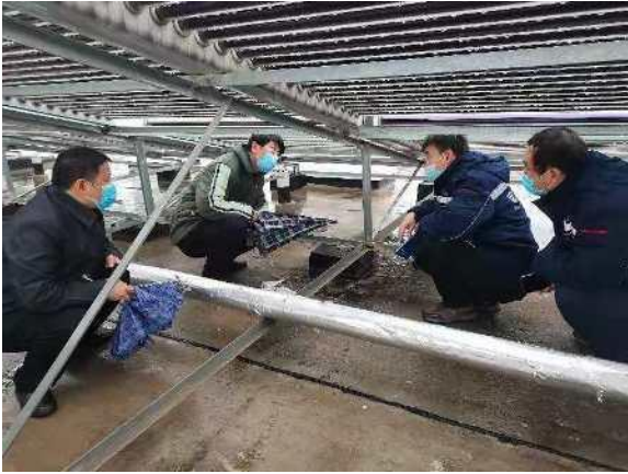
基建处指导太阳能漏水维修工作