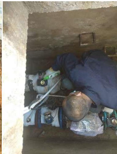
室外阀门加油保养