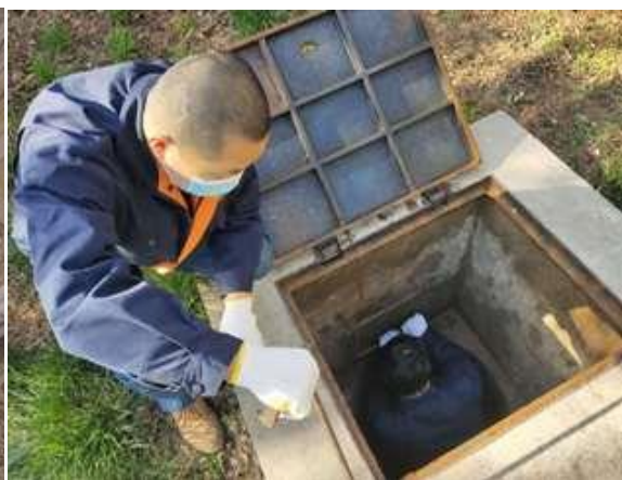
室外阀门加油保养