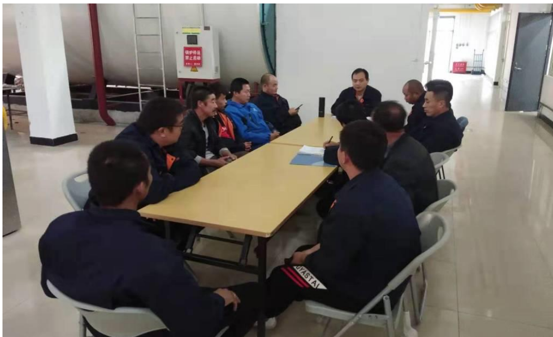
良乡运行班（锅炉房）供暖供热总结会议

2019—2020 年供暖季,物业服务中心供暖供热部良乡校区运行班,以优质高效的服务完成了良乡校区 38 万多平米供暖任务,供暖天然气能耗约 6.86m 3 /m 2 。12 名固定人员,3 名季节工;管理与运行 2 处(东区、西区)锅炉房,14 个交换站;1323 套淋浴系统设备的日常维修保养;2019 年检测淋浴设备 16380 多台次。