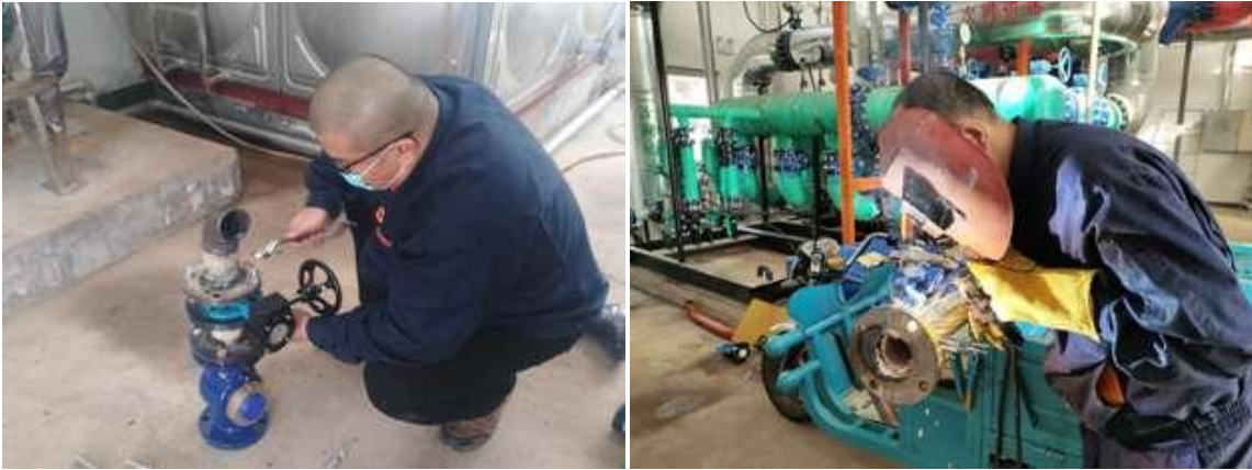
安装水表及阀门施工

2019年4月,我班组对良乡校区东区锅炉房南交换站和北交换站加装了5块水表,8台阀门,少量管道。主要作用是每天统计东区各分支(处)用水量,并监视各处用水量是否正常,如果有用水不正常,便于快速查找原因(或漏水点),对节约用水有很大的帮助。