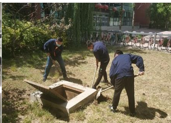
回填下沉积水供暖供热井土方