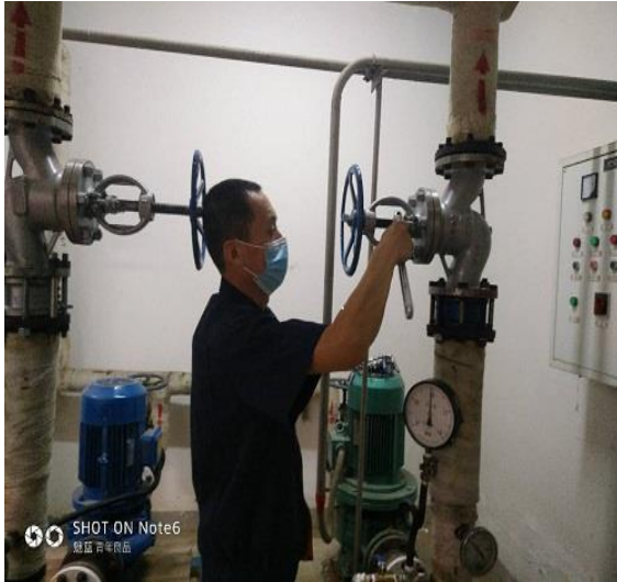
开起阀门、开起循环泵供应热水