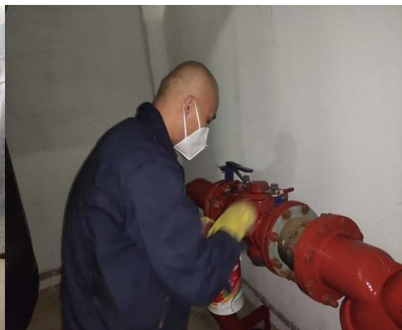
交换站管道及设备除锈、刷漆保养