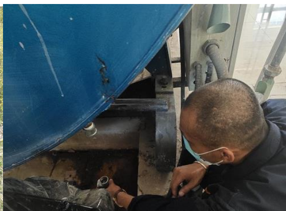
改造锅炉冷凝水管