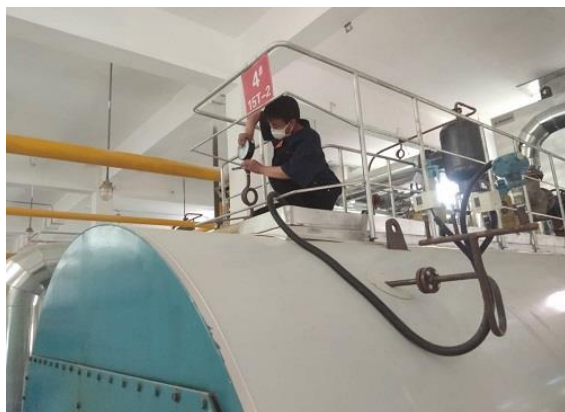
安装 13 块检验后的压力表