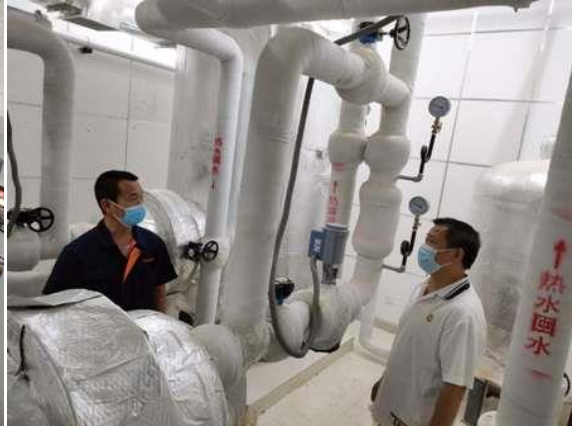
部门主管指导工作