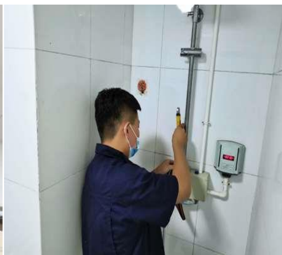
更换留学生楼浴室软管