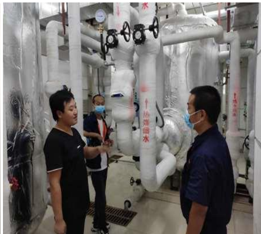
施工方讲解设备使用方法