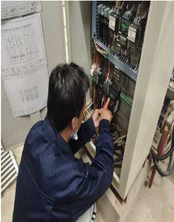
调试并延长供热时间