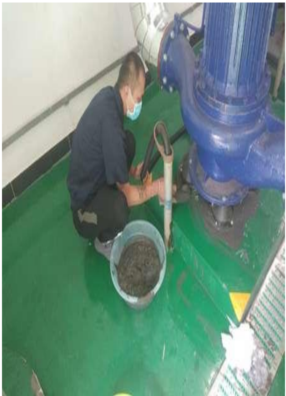
交换站水泵底座维护