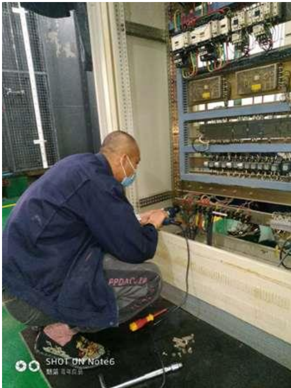
配电柜线路检修紧固接线端子

为确保锅炉房供暖供热工作的安全正常运行，锅炉房工作人员每年至少检修 1—2 次锅炉房以及各个交换站的配电柜，也是常规检查。排除隐患、发现问题及时解决，需要更换电气设备的及时上报上级部门。