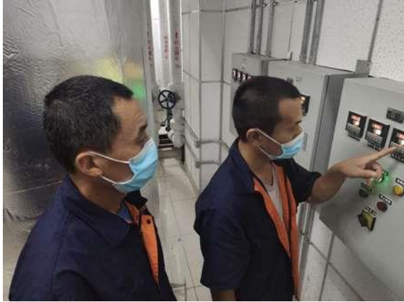
探讨交换站新设备