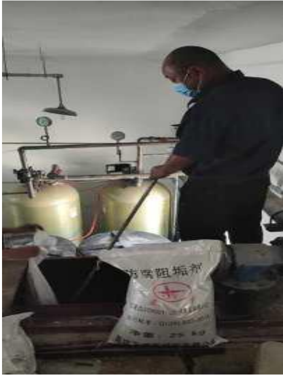
西区锅炉房系统添加阻垢剂