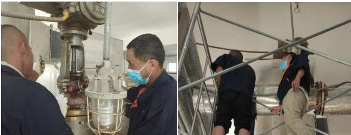
西区锅炉房 3#、4# 锅炉电动阀维修和保养

新生即将报到，我班组抓紧时间抢修锅炉设备，美化区域内环境，调试锅炉水质，加装锅炉阻垢剂等等。员工们兢兢业业、工作不分主次，每件事情都完成得干净漂亮，认真负责。目的是为全体师生提供最高水平、最优质的服务。