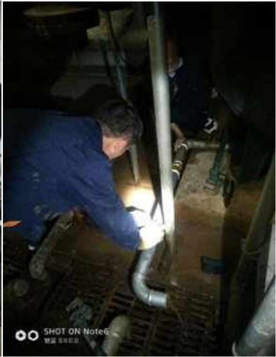
维修换热罐泄水管道