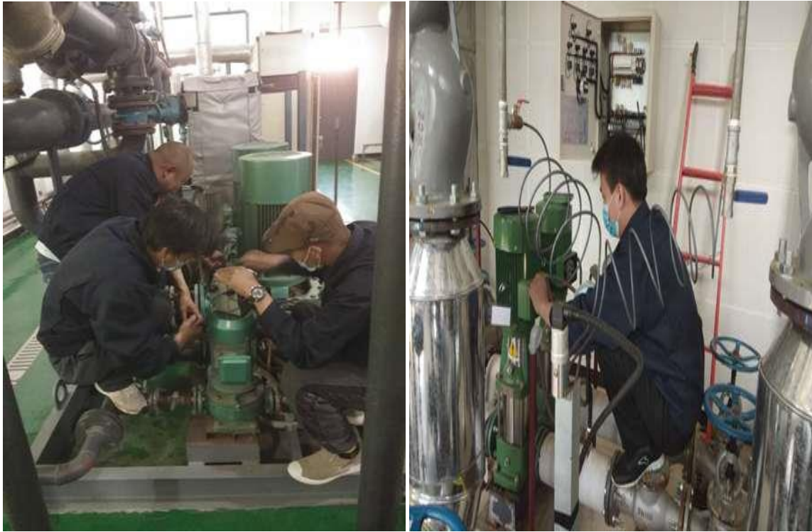
各区域循环泵、补水泵绝缘检测