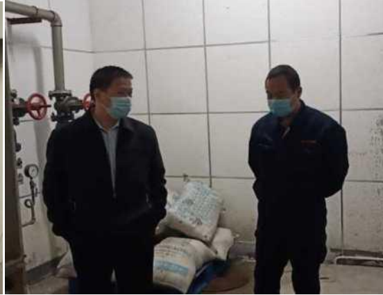
主管指导暖气上水工作