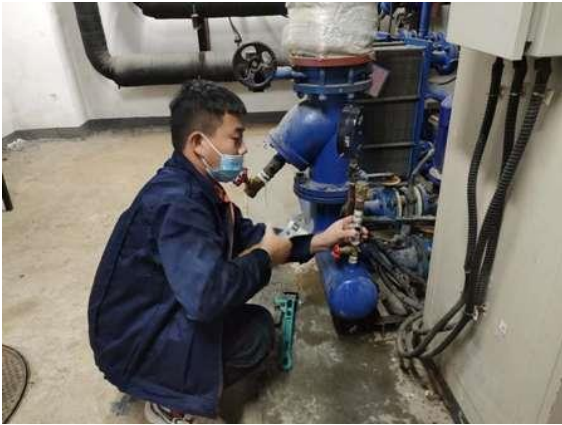
更换供暖交换站放气阀